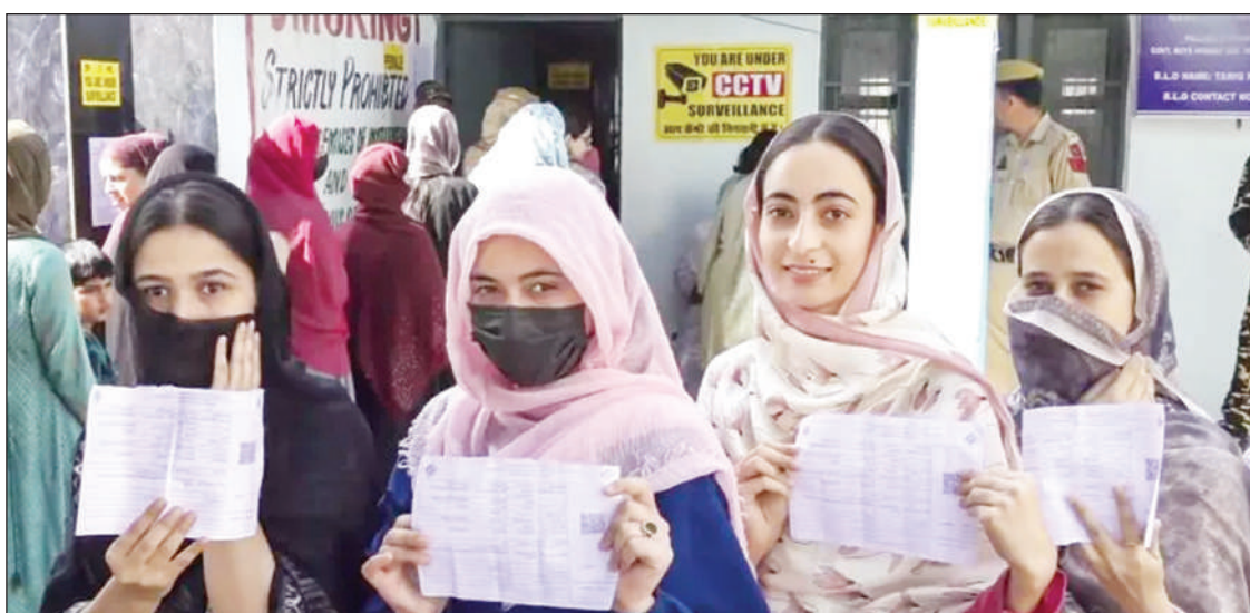
ਕਿਸ਼ਤਵਾੜ 'ਚ ਸਿਰਫ਼ ਔਰਤਾਂ ਲਈ ਬਣੇ ਪੋਲਿੰਗ ਸਟੇਸ਼ਨ ਉਤੇ ਵੋਟਾਂ ਪਾਉਣ ਪੁੱਜੀਆਂ ਮੁਟਿਆਰਾਂ ਵੋਟਰ ਪਰਚੀਆਂ ਦਿਖਾਉਂਦੀਆਂ ਹੋਈਆਂ।

ਸ਼੍ਰੀਨਗਰ : ਜੰਮੂ-ਕਸ਼ਮੀਰ ਅਸੰਬਲੀ ਚੋਣਾਂ ਦੇ ਪਹਿਲੇ ਗੇੜ ਵਿਚ ਵੋਟਰਾਂ ਨੂੰ ਬੁੱਧਵਾਰ ਅਮਨ-ਅਮਾਨ ਵਾਲੇ ਮਾਰਗ 'ਚ ਗੁੰਮ-ਗੁਮਾ ਕੇ ਵੋਟਾਂ ਪਾਈਆਂ। 24 ਸੀਟਾਂ ਲਈ ਸ਼ਾਮ ਪੰਜ ਵਜੇ ਤੱਕ 58.19 ਵੀਸਦੀ ਪੋਲਿੰਗ ਹੋ ਗਈ ਸੀ ਤੇ ਚੋਣ ਅਧਿਕਾਰੀਆਂ ਨੂੰ ਉਦਾਰਤਾ ਪੋਲਿੰਗ 60 ਵੀਸਦੀ ਤੋਂ ਟੋਪ ਜਾਣ ਦੀ ਉਮੀਦ ਸੀ, ਕਿਉਂਕਿ ਬੁਧਵਾਰ ਦੇ ਅਹਾਤਿਆਂ ਵਿਚ ਦਾਖਲ ਹੋ ਚੁੱਕੇ ਵੋਟਰਾਂ ਨੇ ਬਣਨ ਅਜੇ ਦੱਬਣੇ ਸਨ। ਉੱਚ ਇੰਦਰਬਲ ਵਿਚ 80.06 ਵੀਸਦੀ, ਪੰਦਰ-ਨਾਗਸੋਨੀ ਵਿਚ 76.80 ਵੀਸਦੀ, ਕਿਸ਼ਤਵਾੜ ਵਿਚ 75.04 ਵੀਸਦੀ, ਡੋਡਾ ਪੱਛਮੀ ਵਿਚ 74.14 ਵੀਸਦੀ, ਪਹਿਲਗਾਮ ਵਿਚ 67.86 ਵੀਸਦੀ ਤੇ ਕੁਲਗਾਮ ਵਿਚ 59.58 ਵੀਸਦੀ ਪੋਲਿੰਗ ਸ਼ਾਮ ਤੱਕ ਹੋ ਗਈ ਸੀ। ਸਭ ਤੋਂ ਘੱਟ 40.58 ਵੀਸਦੀ ਤਰਾਲ ਵਿਚ ਹੋਈ। ਪੁਲਵਾਮਾ ਜ਼ਿਲ੍ਹੇ ਦੇ ਚਾਰ ਹਲਕਿਆਂ ਵਿਚ ਪੋਲਿੰਗ 50 ਵੀਸਦੀ ਤੋਂ ਨਹੀਂ ਟੱਪੀ ਸੀ। 2014 ਵਿੱਚ 60.03 ਵੀਸਦੀ ਪੋਲਿੰਗ ਹੋਈ ਸੀ।