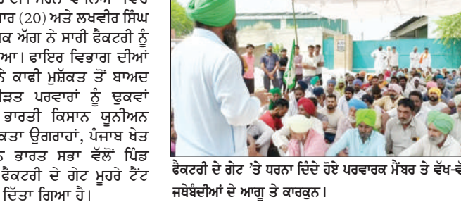
ਫੈਕਟਰੀ ਦੇ ਗੇਟ 'ਤੇ ਧਰਨਾ ਦਿੰਦੇ ਹੋਏ ਪਰਵਾਰ ਮੈਂਬਰ ਤੇ ਵੱਖ-ਵੱਖ ਸੰਬੰਧੀਆਂ ਦੇ ਆਗੂ ਤੇ ਕਾਰਕੁਨ।