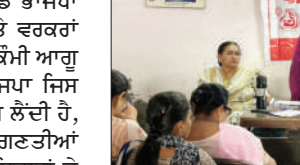
ਸੋਲਾ ਕਾਂਡ ਦਾ ਜ਼ਿਕਰ ਕਰਦੇ ਹੋਏ ਕਿਹਾ ਕਿ ਦੋਸਤੀਆਂ ਧੀਆਂ-ਭੈਣਾਂ ‘ਤੇ ਹੋਏ ਇਨ੍ਹਾਂ ਜ਼ੁਲਮਾਂ ਨੇ ਮੌਦੀ ਸਰਕਾਰ ਦੇ ‘ਬੇਟੀ ਬਚਾਓ, ਬੇਟੀ ਪੜ੍ਹਾਓ’ ਨਾਹਰੇ ਦਾ ਖੋਲ੍ਹਣਾ ਚੰਗਾ ਨਹੀਂ ਹੈ।