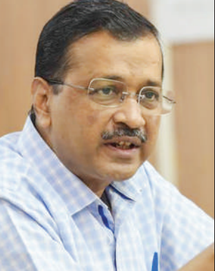
ਉਨ੍ਹਾਂ ਕਿਹਾ ਕਿ ਇਹ ਮਾਮਲਾ ਸਾਡਾ ਚਾਹੀਦਾ ਹੈ। ਬਹੁਤ ਜ਼ਿਆਦਾ ਤਕਨੀਕੀ ਨੁਕਤਿਆਂ ਨਾਲ ਕਿਸੇ ਦੀ ਆਜ਼ਾਦੀ ਨੂੰ ਤਕਨੀਕੀ ਨੁਕਤਿਆਂ ਖਾਤਰ ਨਹੀਂ ਲਟਕਾਇਆ ਜਾ ਸਕਦਾ। ਉਨ੍ਹਾਂ ਕਿਹਾ ਕਿ ਕੇਜਰੀਵਾਲ ਸਮਾਜ ਲਈ ਕੋਈ ਖਤਰਾ ਨਹੀਂ ਹਨ ਅਤੇ ਉਨ੍ਹਾਂ ਨੂੰ ਜ਼ਮਾਨਤ ਉੱਤੇ ਰਿਹਾਅ ਕੀਤਾ ਜਾਵੇ, ਕਿਉਂਕਿ ਇਸ ਮਾਮਲੇ ਵਿਚ ਗ੍ਰਿਫਤਾਰ ਹੋਰ ਮੁਲਜ਼ਮਾਂ ਦੀ ਪਹਿਲਾਂ ਹੀ ਜ਼ਮਾਨਤ ਹੋ ਚੁੱਕੀ ਹੈ।