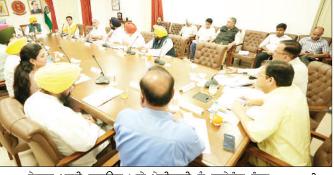
ਵੈਸਲ ਮੰਤਰੀ ਭਗਵੰਤ ਸਿੰਘ ਮਾਨ ਨੇ ਮੁੱਖ ਮੰਤਰੀ ਭਗਵੰਤ ਸਿੰਘ ਮਾਨ ਦੀ ਅਗਵਾਈ ਹੇਠ ਹੋਈ ਮੀਟਿੰਗ ‘ਚ ਪੈਟਰੋਲ ਅਤੇ ਡੀਜ਼ਲ ‘ਤੇ ਵੱਟ ‘ਚ ਵਾਧਾ ਕਰ ਦਿੱਤਾ ਗਿਆ। ਇਸ ਨਾਲ ਸਰਕਾਰ ਨੂੰ 1500 ਕਰੋੜ ਤੋਂ 1800 ਕਰੋੜ ਤੱਕ ਬਚਾਵ ਹੋਵੇਗਾ।