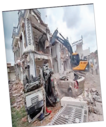
'ਬਲਡੋਜ਼ਰ ਨਿਆਂ' ਦੇ ਦੌਰ 'ਚ... (ਆਖਰੀ ਸਫ਼ੇ 'ਤੇ)