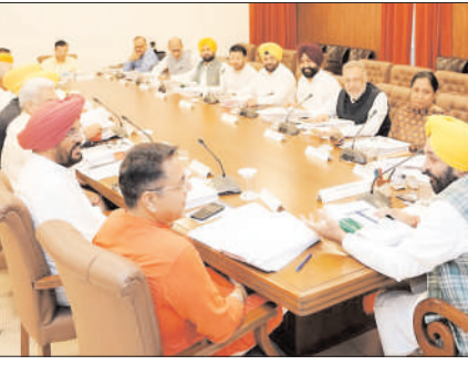
ਮੰਗਲਵਾਰ ਦੀ ਸਾਉਣੀ ਖ਼ਰੀਦ ਸੀਜ਼ਨ ਦੀ ਸ਼ੁਰੂਆਤ ਤੋਂ ਪਹਿਲਾਂ ਹਰੇਕ ਸਾਲ ਕਸਟਮ ਮਿਲਿੰਗ ਪਾਲਿਸੀ ਜਾਰੀ ਕੀਤੀ ਜਾਂਦੀ ਹੈ, ਤਾਂ ਕਿ ਭਾਰਤ ਸਰਕਾਰ ਵੱਲੋਂ ਤੇਜ਼ ਮਾਪਦੰਡਾਂ ਅਨੁਸਾਰ ਸੂਬੇ ਦੀਆਂ ਖ਼ਰੀਦ