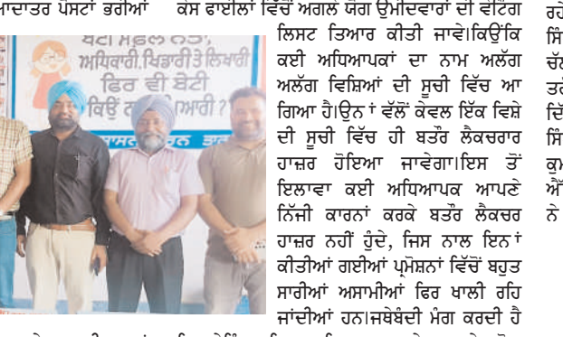
ਗਈਆਂ ਹਨ ਜਿਸ ਨਾਲ ਪੇਂਡੂ ਖੇਤਰ ਦੇ ਸਰਕਾਰੀ ਸਕੂਲਾਂ ਵਿੱਚ ਪੜ੍ਹ ਅਤੇ ਅਮਰ ਪਰਿਵਾਰਾਂ ਦੇ ਬੱਚਿਆਂ ਨੂੰ ਅਧਿਆਪਕਾਂ ਦੀ ਘਾਟ ਦਾ ਸਾਹਮਣਾ ਕਰਨਾ ਪਵੇਗਾ, ਜਿਸ ਨਾਲ ਵਿਦਿਆਰਥੀਆਂ ਦੀ ਗੁਣਾਤਮਕ ਸਿੱਖਿਆ ਨੂੰ ਬਹੁਤ ਨੁਕਸਾਨ ਹੋਵੇਗਾ। ਇਸ ਸਮੇਂ ਆਗੂਆਂ ਵੱਲੋਂ ਸਿੱਖਿਆ ਵਿਭਾਗ ਪੰਜਾਬ ਸਰਕਾਰ ਤੋਂ ਮੰਗ ਕੀਤੀ ਗਈ ਕਿ ਪੰਜਾਬ ਦੇ ਸਾਰੇ ਸੀਨੀਅਰ ਸੈਕੰਡਰੀ ਸਕੂਲਾਂ ਵਿੱਚ ਮਨਜ਼ੂਰਤਾ ਸਾਰੀਆਂ ਖਾਲੀ ਅਸਾਮੀਆਂ ਆਨਲਾਈਨ ਦੀ