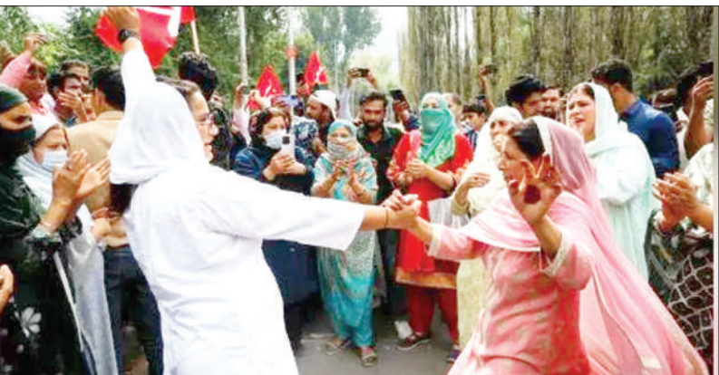
ਨੈਸ਼ਨਲ ਕਾਨਫਰੰਸ ਦੀਆਂ ਸਮਰਥਕ ਬੀਬੀਆਂ ਸ਼੍ਰੀਨਗਰ ਦੇ ਇਕ ਗਿਣਤੀ ਕੇਂਦਰ ਦੇ ਬਾਹਰ ਕਿੱਕਲੀ ਪਾਉਂਦੀਆਂ ਹੋਈਆਂ।

ਸ਼੍ਰੀਨਗਰ : ਕੇਂਦਰ ਸ਼ਾਸਤ ਪ੍ਰਦੇਸ਼ ਜੰਮੂ-ਕਸ਼ਮੀਰ ਵਿਚ ਨੈਸ਼ਨਲ ਕਾਨਫਰੰਸ, ਕਾਂਗਰਸ ਤੋਂ ਮਾਰਕਸੀ ਪਾਰਟੀ ਦੇ ‘ਇੰਡੀਆ’ ਗੱਠਜੋੜ ਨੇ 90 ਵਿੱਚੋਂ 49 ਸੀਟਾਂ ਜਿੱਤ ਕੇ ਬਹੁਮਤ ਹਾਸਲ ਕਰ ਲਿਆ। ਲੈਫਟੀਨੈਂਟ ਗਵਰਨਰ ਨੂੰ ਪੰਜ ਵਿਧਾਇਕ ਨਾਮਜ਼ਦ ਕਰਨ ਦਾ ਹੱਕ ਹੈ ਤੇ ਉਸ ਸੂਰਤ ‘ਚ ਅੰਤਿਮ 95 ਮੈਂਬਰੀ ਬਣਨ ‘ਤੇ ਬਹੁਮਤ ਲਈ ਲੋੜੀਂਦੀਆਂ ਸੀਟਾਂ 48 ਤੋਂ ਇੰਡੀਆ ਦੀਆਂ ਸੀਟਾਂ ਵੱਧ ਹੋ ਗਈਆਂ ਹਨ। ਇਸ ਤਰ੍ਹਾਂ ਸੱਤਾ ‘ਤੇ ਕਿਸੇ ਨਾ ਕਿਸੇ ਤਰ੍ਹਾਂ ਕਬਜ਼ਾ ਕਰਨ ਦਾ ਭਾਜਪਾ ਦਾ ਮਰਜ਼ੀ ਦੇ ਪੰਜ ਵਿਧਾਇਕ ਨਾਮਜ਼ਦ ਕਰਨ ਵਾਲਾ ਦਾਅ ਵੀ ਕਾਮਯਾਬ ਨਹੀਂ ਹੋਵੇਗਾ।