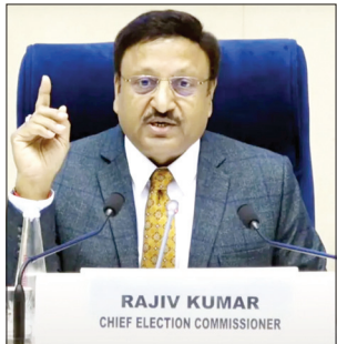
RAJIV KUMAR CHIEF ELECTION COMMISSIONER

ਨਵੀਂ ਦਿੱਲੀ : ਚੋਣ ਕਮਿਸ਼ਨ ਨੇ ਮੰਗਲਵਾਰ ਮਹਾਰਾਸ਼ਟਰ ਅਤੇ ਝਾਰਖੰਡ ਵਿਧਾਨ ਸਭਾਵਾਂ ਦੀਆਂ ਚੋਣਾਂ ਦੀਆਂ ਤਾਰੀਖਾਂ ਦਾ ਐਲਾਨ ਕਰ ਦਿੱਤਾ। ਮਹਾਰਾਸ਼ਟਰ 'ਚ ਵੋਟਾਂ ਇੱਕ ਗੋੜ 'ਚ 20 ਨਵੰਬਰ ਨੂੰ ਪੈਣਗੀਆਂ, ਜਦੋਂਕਿ ਝਾਰਖੰਡ 'ਚ ਦੋ ਗੋੜਾਂ 'ਚ 13 ਤੇ 20 ਨਵੰਬਰ ਨੂੰ ਪੈਣਗੀਆਂ। ਇਹ ਐਲਾਨ ਮੁੱਖ ਚੋਣ ਕਮਿਸ਼ਨਰ ਰਾਜੀਵ ਕੁਮਾਰ ਨੇ ਪ੍ਰੈਸ ਕਾਨਫਰੰਸ 'ਚ ਕੀਤਾ। ਮਹਾਰਾਸ਼ਟਰ ਵਿਧਾਨ ਸਭਾ ਦੀਆਂ 288 ਸੀਟਾਂ ਹਨ ਅਤੇ ਮੌਜੂਦਾ ਵਿਧਾਨ ਸਭਾ ਦੀ ਮਿਆਦ 26 ਨਵੰਬਰ ਨੂੰ ਪੂਰੀ ਹੋਵੇਗੀ। 25 ਸੀਟਾਂ ਅਨੁਸੂਚਤ ਕਬੀਲਿਆਂ (ਐੱਸ ਟੀ) ਅਤੇ 29 ਅਨੁਸੂਚਤ ਜਾਤਾਂ (ਐੱਸ ਸੀ) ਲਈ ਰਾਖਵੀਆਂ ਹਨ, ਜਦੋਂਕਿ 234 ਸੀਟਾਂ ਜਨਰਲ ਹਨ।