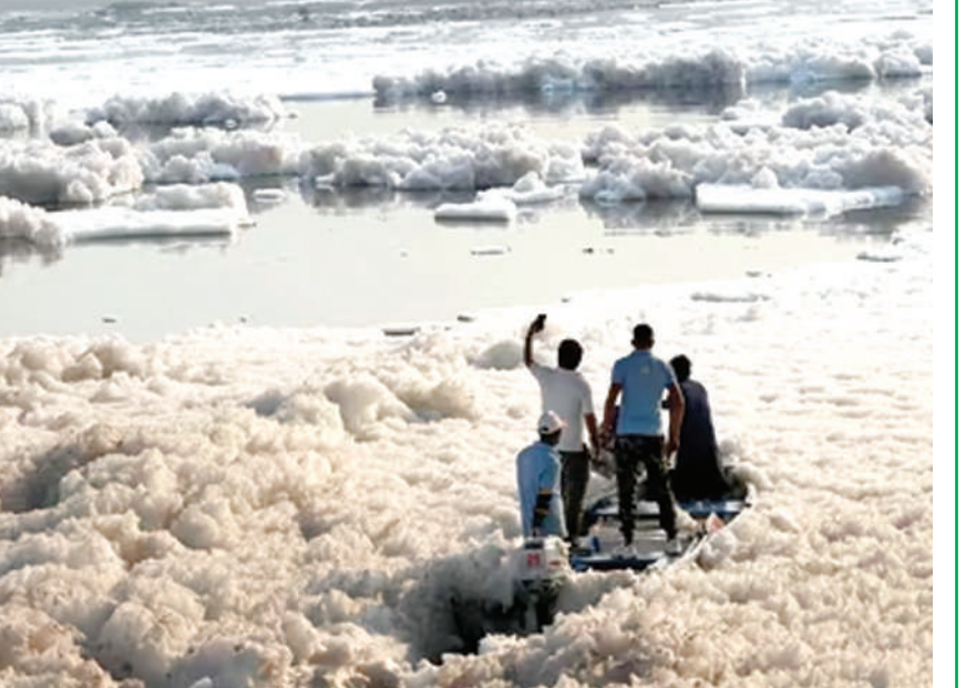
ਪ੍ਰਸਿੱਧ ਛਠ ਪੂਜਾ ਉਤਸਵ 6 ਤੋਂ 8 ਨਵੰਬਰ ਤੱਕ ਮਨਾਇਆ ਜਾਣਾ ਹੈ, ਜਿਸ ਦੌਰਾਨ ਲੋਕ ਨਦੀਆਂ 'ਚ ਡੁਬਕੀ ਲਾਉਂਦੇ ਹਨ। ਦਿੱਲੀ ਵਿਚ ਜਿਹੜੀ ਜਮਨਾ 'ਚ ਲੋਕਾਂ ਨੇ ਡੁਬਕੀ ਲਾਉਣੀ ਹੈ, ਉਸ ਦਾ ਐਤਵਾਰ ਇਹ ਹਾਲ ਸੀ। ਪੁਸ਼ਾਸਨ ਨਦੀ 'ਚ ਵੱਲੀ ਜਹਿਰੀਲੀ ਝੰਗ ਹਟਾਉਣ 'ਚ ਲੱਗਾ ਹੋਇਆ ਸੀ।