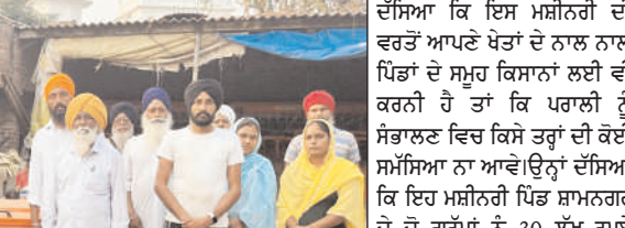
ਦੱਸਿਆ ਕਿ ਇਸ ਮਸ਼ੀਨਰੀ ਦੀ ਵਰਤੋਂ ਆਪਣੇ ਖੇਤਾਂ ਦੇ ਨਾਲ ਨਾਲ ਪਿੰਡਾਂ ਦੇ ਸਮੂਹ ਕਿਸਾਨਾਂ ਲਈ ਵੀ ਕਰਨੀ ਹੈ ਤਾਂ ਕਿ ਪਹਾਲੀ ਨੂੰ ਸੰਭਾਲਣ ਵਿਚ ਕਿਸੇ ਤਰ੍ਹਾਂ ਦੀ ਕੋਈ ਸਮੱਸਿਆ ਨਾ ਆਵੇ। ਦੱਸਿਆ ਕਿ ਇਹ ਮਸ਼ੀਨਰੀ ਪਿੰਡ ਸ਼ਾਮਨਗਰ ਦੇ ਗਰੁੱਪਾਂ ਨੂੰ 30 ਲੱਖ ਰੁਪਏ ਹਰੇਕ ਗਰੁੱਪ ਨੂੰ ਵਿਭਾਗ ਵੱਲੋਂ ਲੈ ਕੇ ਦਿੱਤੀ ਹੈ ਜਿਸ ਵਿਚ ਪਹਿਲੇ ਗਰੁੱਪ ਵਿਚ ਟਰੈਕਟਰ, ਬੇਲਰ, ਬੇਲਰ ਦਾ ਸਾਮਾਨ ਅਤੇ ਹੋਰਕ ਲੈਂਕੇ ਦਿੱਤੇ। ਦੂਜੇ ਗਰੁੱਪ ਵਿਚ ਸੁਪਰ ਸੀਡਰ, ਸਰਵਸ ਸੀਡਰ, ਉਲਟਾਵਾਂ ਹੱਲ, ਗੋਹਰ ਅਤੇ ਚੂਹਰ ਲੈ ਕੇ ਦਿੱਤੇ ਹਨ। ਕਿਸਾਨਾਂ ਨੂੰ ਅਪੀਲ ਕਰਦਿਆਂ ਉਨ੍ਹਾਂ ਨੇ ਕਿਹਾ ਕਿ ਕਿਸਾਨ ਅੱਜ ਇਹ ਪੁਣ ਕਰਨ ਕਿ ਅੱਜ ਤੋਂ ਬਾਅਦ ਖੇਤਾਂ ਦੀ ਰਹਿਣ ਖੁੰਦ ਨੂੰ ਔਂਗ ਨਹੀਂ ਲਗਾਉਣਗੇ।