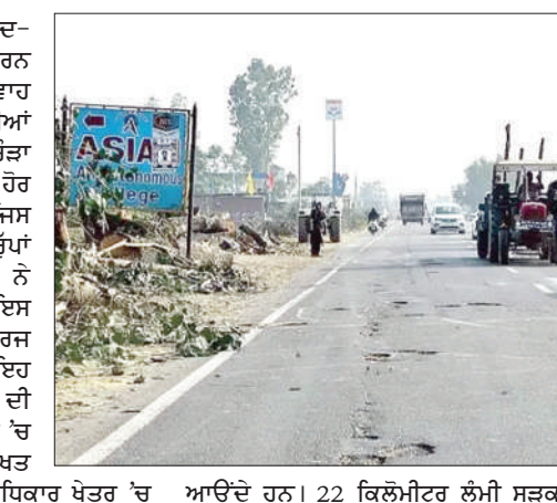
ਪਟਿਆਲਾ : ਸਰਹਿੰਦ-ਪਟਿਆਲਾ ਸੜਕ ਨੂੰ ਚੌੜਾ ਕਰਨ ਲਈ ਦਰੱਖਤਾਂ ਦੀ ਅਨੁਵਾਹ ਕਟਾਈ 'ਤੇ ਵਾਤਾਵਰਨ ਪ੍ਰੇਮੀਆਂ ਵਿਚ ਰੋਸ ਹੈ। ਇਸ ਸੜਕ ਨੂੰ ਚੌੜਾ ਕਰਨ ਲਈ ਇੱਕ ਹਜ਼ਾਰ ਹੋਰ ਦਰੱਖਤ ਕੱਟੇ ਜਾਣਗੇ, ਜਿਸ ਖਿਲਾਫ ਸਿਵਲ ਸੁਸਾਇਟੀ ਗਰੁੱਪਾਂ ਅਤੇ ਵਾਤਾਵਰਨ ਪ੍ਰੇਮੀਆਂ ਨੇ ਮੋਰਚਾ ਖੋਲ੍ਹ ਦਿੱਤਾ ਹੈ। ਉਨ੍ਹਾਂ ਇਸ ਸੰਬੰਧੀ ਸ਼ਿਕਾਇਤ ਦਰਜ ਕਰਵਾਉਂਦਿਆਂ ਕਿਹਾ ਕਿ ਇਹ ਦਰੱਖਤ ਪੀ ਡਬਲਊ ਡੀ ਦੀ ਸੜਕ ਚੌੜੀ ਕਰਨ ਦੀ ਯੋਜਨਾ 'ਚ ਨਹੀਂ ਆਉਂਦੇ ਸਗੋਂ ਇਹ ਦਰੱਖਤ ਪਟਿਆਲਾ ਵਣ ਮੰਡਲ ਦੇ ਅਧਿਕਾਰ ਖੇਤਰ 'ਚ ਆਉਂਦੇ ਹਨ। 22 ਕਿਲੋਮੀਟਰ ਲੰਮੀ ਸੜਕ ਦੇ ਫੀਡਬੈਕ ਵੈਰੀਫਿਕੇਸ਼ਨ ਦੇ ਹੁਕਮ ਦਿੱਤੇ ਗਏ ਹਨ।