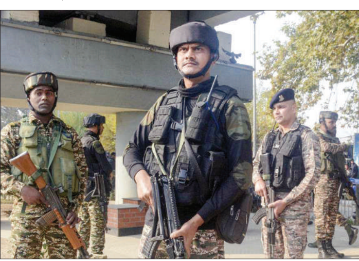
ਦੁਕਾਨਦਾਰਾਂ 'ਤੇ ਗੁਨੇਡ ਹਮਲੇ ਦੀ ਖ਼ਬਰ ਬਹੁਤ ਹੀ ਦੁਖਦਾਈ ਹੈ। ਬੇਕਸੂਰ ਨਾਗਰਿਕਾਂ ਨੂੰ ਨਿਸ਼ਾਨਾ ਬਣਾਉਣਾ ਜਾਇਜ਼ ਨਹੀਂ ਹੋ ਸਕਦਾ। ਸੁਰੱਖਿਆ ਤੰਤਰ ਨੂੰ ਚਾਹੀਦਾ ਹੈ ਕਿ ਉਹ ਹਮਲਿਆਂ ਦੀ ਇਸ ਲਹਿਰ ਨੂੰ ਜਲਦੀ ਤੋਂ ਜਲਦੀ ਰੋਕਣ ਲਈ ਹਰ ਸੰਭਵ ਯਤਨ ਕਰੇ, ਤਾਂ ਜੋ ਲੋਕ ਬਿਨਾਂ ਕਿਸੇ ਭਰ ਦੇ ਆਪਣੀ ਜ਼ਿੰਦਗੀ ਬਤੀਤ ਕਰ ਸਕਣ।

ਸ਼੍ਰੀਨਗਰ : ਐਤਵਾਰ ਇੱਥੇ ਟੂਰਿਸਟ ਰਿਸੋਰਟ ਮਿਲਿਟਰੀ ਡੈਂਚ ਨੇੜੇ ਲਗਦੀ ਸੋਫ਼ ਮਾਰਕਿਟ ਕੋਲ ਸੀ ਅਰ ਪੀ ਐੱਫ ਦੇ ਮੋਰਚੇ 'ਤੇ ਗੁਨੇਡ ਹਮਲਾ 'ਚ 12 ਵਿਅਕਤੀ ਜ਼ਖ਼ਮੀ ਹੋ ਗਏ। ਸ਼ਹਿਰ ਦੇ ਖਾਨਿਆਰ ਇਲਾਕੇ 'ਚ ਸੁਰੱਖਿਆ ਬਲਾਂ ਵੱਲੋਂ ਲਾਸ਼ਕਰ-ਏ-ਤੋਇਬਾ ਦੇ ਇਕ ਪਾਕਿਸਤਾਨੀ ਕਮਾਂਡਰ ਨੂੰ ਮਾਰ ਜਾਣ ਤੋਂ ਇਕ ਦਿਨ ਬਾਅਦ ਵਿਆਪਕ ਸੁਰੱਖਿਆ ਵਾਲੇ ਆਲ ਇੰਡੀਆ ਰੋਡੀਓ ਤੇ ਦੁਰਦਰਸ਼ਨ ਦੇ ਦਰਵਾਜ਼ੇ ਨੇੜੇ ਇਹ ਹਮਲਾ ਹੋਇਆ। ਅਧਿਕਾਰੀਆਂ ਨੇ ਦੱਸਿਆ ਕਿ ਦਰਿਸ਼ਤਗਰਦਾਂ ਨੇ ਗੁਨੇਡ ਸੀ ਅਰ ਪੀ ਐੱਫ ਦੇ ਮੋਰਚੇ ਵੱਲ ਸੁੱਟਿਆ, ਪਰ ਉਹ ਗਾਰ 'ਚ ਡਿੱਗ ਕੇ ਫਟ ਗਿਆ। ਸੋਫ਼ ਮਾਰਕਿਟ 'ਚ ਹਜ਼ਾਰਾਂ ਲੋਕ ਆਉਂਦੇ ਹਨ। ਜੰਮੂ-ਕਸ਼ਮੀਰ ਦੇ ਮੁੱਖ ਮੰਤਰੀ ਉਮਰ ਆਬਦੁੱਲਾ ਨੇ ਕਿਹਾ ਕਿ ਪਿਛਲੇ ਕੁਝ ਦਿਨਾਂ ਤੋਂ ਵਾਦੀ ਦੇ ਕਥੀ ਹਿੰਸਿਆਂ ਵਿਚ ਹਮਲਿਆਂ ਤੇ ਮੁਕਾਬਲਿਆਂ ਦੀਆਂ ਖ਼ਬਰਾਂ ਸੁਰੱਖਿਆ 'ਚ ਹਨ। ਸੋਫ਼ ਮਾਰਕਿਟ 'ਚ ਬੇਕਸੂਰ