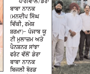
ਮੁਲਾਜ਼ਮ 9 ਨਵੰਬਰ ਨੂੰ ਡੇਰਾ ਗਿਣਤੀ ਵਿੱਚ ਹਲਕਾ ਡੇਰਾ ਬਾਬਾ ਨਾਨਕ ਵਿੱਚ ਇਕੱਠੇ ਹੋਣਗੇ ਅਤੇ ਹੋਲੀ ਕਰਨ ਉਪਰੰਤ ਵੱਖ-ਵੱਖ ਬਾਸ਼ਾਵਾਂ ਵਿੱਚ ਰੋਸ ਮਾਰਚ ਕੱਢਿਆ ਜਾਵੇਗਾ ਅਤੇ ਸਰਕਾਰ ਦੀਆਂ ਨੀਤੀਆਂ ਲੋਕਾਂ ਨੂੰ ਦੱਸੀਆਂ ਜਾਣਗੀਆਂ ਜਿਹੜੀਆਂ ਸਰਕਾਰ ਨੇ ਫਿਰ ਵੀ ਨਾ ਜਾਰੀ ਤੋਂ ਬਾਅਦ ਹੋਰ ਔਕੜਾਂ ਨੂੰ ਤੋੜ ਕੀਤਾ ਜਾਵੇਗਾ।