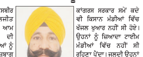
ਕਾਂਗਰਸ ਸਰਕਾਰ ਸਮੇਂ ਕਦੇ ਵੀ ਕਿਸਾਨ ਮੰਡੀਆਂ ਵਿੱਚ ਖੱਬਲ ਖੁਆਰ ਨਹੀਂ ਸੀ ਹੋਏ। ਉਹਨਾਂ ਨੂੰ ਜ਼ਿਆਦਾ ਟਾਈਮ ਮੰਡੀਆਂ ਵਿੱਚ ਨਹੀਂ ਸੀ ਰਹਿਣਾ ਪੈਂਦਾ। ਜਲਦੀ ਉਹਨਾਂ ਦੀ ਜਿਲਦ ਪਿਕ ਜਾਂਦੀ ਸੀ ਅਤੇ ਰੋਟ ਵੀ ਵਾਜਬ ਲੱਗ ਜਾਂਦਾ ਸੀ। ਉਹਨਾਂ ਕਿਹਾ ਕਿ ਪੰਜਾਬ ਦੀ ਜਨਤਾ ਅੱਜ ਵੀ ਕਾਂਗਰਸ ਸਰਕਾਰ ਦੇ ਰਾਜ ਨੂੰ ਯਾਦ ਕਰਦੀ ਹੈ ਅਤੇ ਬੜੀ ਬੇਸ਼ਰੀ ਨਾਲ 2027 ਵਿੱਚ ਦੁਬਾਰਾ ਕਾਂਗਰਸ ਸਰਕਾਰ ਬਣਨ ਦਾ ਇੰਤਜ਼ਾਜ਼ ਕਰ ਰਹੀ ਹੈ। ਇਹਨਾਂ ਜਿਮਨੀ ਚੋਣਾਂ ਵਿੱਚ ਕਾਂਗਰਸ ਪਾਰਟੀ ਦੇ ਉਮੀਦਵਾਰ ਬਾਨਦਾਰ ਜਿੰਤ ਹਾਸਲ ਕਰਨਗੇ ਅਤੇ ਜਿਲ੍ਹਾ ਪੰਚਾਇਤ, ਬਲਕ ਸਿੱਖੀ, ਨਗਰ ਨਿਗਮ ਅਤੇ ਨਗਰ ਪਾਲਿਕਾਵਾਂ ਦੀਆਂ ਚੋਣਾਂ ਵਿੱਚ ਵੀ ਕਾਂਗਰਸ ਪਾਰਟੀ ਦੇ ਉਮੀਦਵਾਰ ਹੀ ਜਿੱਤ ਹਾਸਲ ਕਰਨਗੇ।