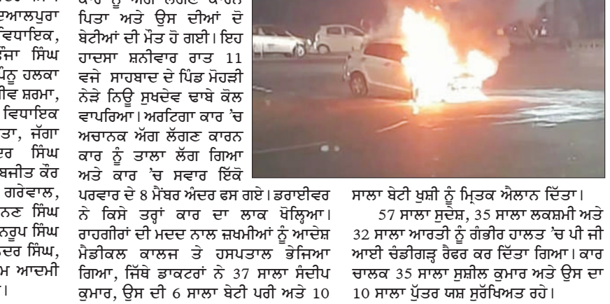
ਸ਼੍ਰੀਮੰਤਰੀ ਦੇ ਪਿੱਛੇ ਰਹਿਮਾਣਾ 'ਚ ਦੀਵਾਲੀ ਮਨਾ ਕੇ ਚੰਡੀਗੜ੍ਹ ਪਰਤ ਰਹੇ ਪਰਵਾਰ ਦੀ ਚੱਲਦੀ ਕਾਰ ਨੂੰ ਅੱਗ ਲੱਗਣ ਕਾਰਨ ਪਿਤਾ ਅਤੇ ਉਸ ਦੀਆਂ ਦੋ ਬੇਟੀਆਂ ਦੀ ਮੌਤ ਹੋ ਗਈ। ਇਹ ਹਾਦਸਾ ਸ਼ਨੀਵਾਰ ਰਾਤ 11 ਵਜੇ ਸਰਕਾਰ ਦੇ ਪਿੱਛੇ ਮੋਹੜੀ ਨੇੜੇ ਨਿਊ ਸੁਖਦੇਵ ਵਾਬੇ ਕੋਲ ਵਾਪਰਿਆ। ਅੱਗ ਲੱਗਣ ਕਾਰਨ 'ਚ ਅਚਾਨਕ ਅੱਗ ਲੱਗਣ ਕਾਰਨ ਕਾਰ ਨੂੰ ਤਾਲਾ ਲੱਗ ਗਿਆ ਅਤੇ ਕਾਰ 'ਚ ਸਵਾਰ ਇੱਕ ਪਰਵਾਰ ਦੇ 8 ਮੈਂਬਰ ਅੰਦਰ ਫਸ ਗਏ। ਡਰਾਈਵਰ ਨੇ ਕਿਸੇ ਤਰ੍ਹਾਂ ਕਾਰ ਦਾ ਲਾਕ ਖੋਲ੍ਹਿਆ। ਰਾਹਗੀਰਾਂ ਦੀ ਮਦਦ ਨਾਲ ਜ਼ਖ਼ਮੀਆਂ ਨੂੰ ਆਦੇਸ਼ ਮੈਡੀਕਲ ਕਾਲਜ ਤੇ ਹਸਪਤਾਲ ਭੇਜਿਆ ਗਿਆ, ਜਿੱਥੇ ਡਾਕਟਰਾਂ ਨੇ 37 ਸਾਲਾ ਸੋਦੀਪ ਕੁਮਾਰ, ਉਸ ਦੀ 6 ਸਾਲਾ ਬੇਟੀ ਪਰੀ ਅਤੇ 10 ਸਾਲਾ ਬੇਟੀ ਖੁਸ਼ੀ ਨੂੰ ਮਿਠਕ ਐਲਾਨ ਦਿੱਤਾ। 57 ਸਾਲਾ ਸੁਦੇਸ਼, 35 ਸਾਲਾ ਲਕਸ਼ਮੀ ਅਤੇ 32 ਸਾਲਾ ਆਰਤੀ ਨੂੰ ਗੰਭੀਰ ਹਾਲਤ 'ਚ ਪੀ ਨੀ ਆਈ ਚੰਡੀਗੜ੍ਹ ਹੋਸਪੀਟਲ ਵਿੱਚ ਦਿੱਤਾ ਗਿਆ। ਕਾਰ ਚਾਲਕ 35 ਸਾਲਾ ਸ਼੍ਰੀਲਕੁਮਾਰ ਅਤੇ ਉਸ ਦਾ 10 ਸਾਲਾ ਪੁੱਤਰ ਯਸ਼ ਸੁਰੱਖਿਅਤ ਰਹੇ।