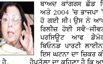
ਬਾਅਦ ਕਾਂਗਰਸ ਡੱਫ਼ ਦਿੱਤੀ ਸੀ ਅਤੇ 2004 'ਚ ਭਾਜਪਾ 'ਚ ਸ਼ਾਮਲ ਹੋ ਗਈ ਸੀ। ਉਸ ਨੇ ਆਪਣੀ ਹੁਣੇ ਗਿੱਲਜ਼ ਹੋਈ ਸਵੈ-ਜੀਵਨੀ 'ਨਿਯ ਪੁਰਸਿਊਟ ਪਾਠ' ਵੇਰੋਕਰਮੀ : ਬਿਦਨਤ ਆਣਟੀ ਲਾਈਨਜ਼' ਵਿੱਚ ਇਸ ਘਟਨਾ ਦਾ ਜ਼ਿਕਰ ਕੀਤਾ ਹੈ। ਹੈਪਤੁੱਲਾ ਦਾ ਕਹਿਣਾ ਹੈ ਕਿ ਆਈ ਪੀ ਯੂ ਦੀ ਪ੍ਰਧਾਨਗੀ ਮਿਲਣਾ ਇਤਿਹਾਸਕ ਪਲ ਸੀ, ਜੋ ਭਾਰਤੀ ਸੋਸ਼ਲ ਡੈਮੋਕਰੇਟਿਕ ਪੱਛਮ ਤੋਂ ਆਈ ਹੈ। ਉਸ ਨੇ ਲਿਖਿਆ ਹੈ—ਮੈਂ ਸ਼ਰ ਤੋਂ ਪਹਿਲਾਂ ਪ੍ਰਧਾਨ ਮੰਤਰੀ ਅਟਲ ਬਿਹਾਰੀ ਵਾਜਪਾਈ ਨੂੰ ਟੈਲੀਫੋਨ ਕੀਤਾ ਅਤੇ ਉਨ੍ਹਾਂ ਨੇ ਤੁਰੰਤ ਮੇਰੇ ਫੋਨ ਦਾ ਜਵਾਬ ਦਿੱਤਾ। ਇਹ

ਨਵੀਂ ਦਿੱਲੀ : ਇਟਰ-ਪਾਰਲੀਮੈਂਟਰੀ ਯੂਨੀਅਨ (ਆਈ ਪੀ ਯੂ) ਦੀ 1999 ਵਿਚ ਪ੍ਰਧਾਨ ਚੁੱਕੇ ਜਾਣ ਤੋਂ ਬਾਅਦ ਨਜ਼ਮਾ ਹੈਪਤੁੱਲਾ ਨੇ ਬਹੁਗਿਣਤੀ ਤੋਂ ਤੱਤਕਾਲੀ ਕਾਂਗਰਸ ਪ੍ਰਧਾਨ ਸੋਨੀਆ ਗਾਂਧੀ ਨੂੰ ਇਹ ਖਬਰ ਦੱਸਣ ਲਈ ਫੋਨ ਕੀਤਾ ਕਿ ਉਹ ਇਸ ਯੂਨੀਅਨ ਦੀ ਪ੍ਰਧਾਨ ਬਣ ਗਈ ਹੈ, ਪਰ ਨਜ਼ਮਾ ਨੂੰ ਸੋਨੀਆ ਗਾਂਧੀ ਨਾਲ ਗੱਲ ਕਰਨ ਲਈ ਇੱਕ ਘੰਟਾ ਉਡੀਕ ਕਰਨੀ ਪਈ ਅਤੇ ਉਡੀਕ ਦੇ ਬਾਵਜੂਦ ਸੋਨੀਆ ਗਾਂਧੀ ਨੇ ਉਸ ਨਾਲ ਗੱਲ ਨਾ ਕੀਤੀ।