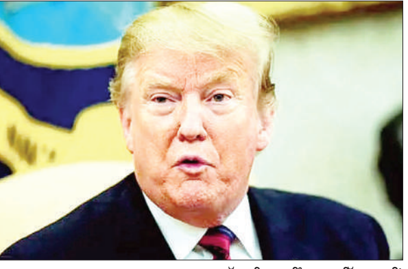
ਹਨ, ਪਰ ਭਾਰਤ ਹੁਣ ਤੱਕ ਇਸ ਮੁਹਿੰਮ ਦਾ ਹਿੱਸਾ ਨਹੀਂ ਬਣਿਆ ਹੈ। ਹੁਣ ਟਰੰਪ ਨੇ ਇਨ੍ਹਾਂ ਬਰਿਕਸ ਦੇਸ਼ਾਂ ਨੂੰ ਅਜਿਹੇ ਕਦਮ ਖਿਲਾਫ ਚਿਤਾਵਨੀ ਦਿੱਤੀ ਹੈ। ਟਰੰਪ ਨੇ ਕਿਹਾ-ਸਾਨੂੰ ਇਨ੍ਹਾਂ ਦੇਸ਼ਾਂ ਤੋਂ ਵਚਨਬੱਧ ਕਰਨੀ ਲੋੜ ਹੈ ਕਿ ਉਹ ਨਾ ਹੀ ਕੋਈ ਨਵੀਂ ਬਰਿਕਸ ਕਰਮੀ ਬਣਾਉਣਗੇ ਤੇ ਨਾ ਹੀ ਨਵੀਂ ਕਰਮੀ ਦਾ ਸਮਰਥਨ ਕਰਨਗੇ, ਨਹੀਂ ਤਾਂ ਉਨ੍ਹਾਂ ਨੂੰ 100 ਫੀਸਦੀ ਟੈਰਿਫ ਦਾ ਸਾਹਮਣਾ ਕਰਨਾ ਪਵੇਗਾ ਅਤੇ ਉਹ ਅਮਰੀਕੀ ਅਰਥਵਿਵਸਥਾ 'ਚ ਆਪਣੇ ਉਤਪਾਦ ਵੇਚ ਨਹੀਂ ਸਕਣਗੇ।

ਵਾਸ਼ਿੰਗਟਨ : ਡੋਨਾਲਡ ਟਰੰਪ ਨੇ ਅਮਰੀਕਾ ਦੇ ਰਾਸ਼ਟਰਪਤੀ ਵਜੋਂ ਅਗਲੇ ਸਾਲ 20 ਨਵੰਬਰ ਨੂੰ ਸ਼ੁਰੂ ਚੁੱਕਣੀ ਹੈ ਪਰ ਉਸ ਨੇ ਪਹਿਲਾਂ ਹੀ ਬਰਿਕਸ ਦੇਸ਼ਾਂ ਨੂੰ ਯਕਾਰੀਆਂ ਸ਼ੁਰੂ ਕਰ ਦਿੱਤਾ ਹੈ। ਟਰੰਪ ਨੇ ਇਨ੍ਹਾਂ ਦੇਸ਼ਾਂ ਨੂੰ ਚਿਤਾਵਨੀ ਦਿੱਤੀ ਕਿ ਜੇ ਉਨ੍ਹਾਂ ਨੇ ਕਿਸੇ ਹੋਰ ਕਰਮੀ ਦਾ ਸਮਰਥਨ ਕੀਤਾ ਤਾਂ ਉਨ੍ਹਾਂ 'ਤੇ ਸੇਂ ਫੀਸਦੀ ਟੈਰਿਫ (ਦੂਜੇ ਦੇਸ਼ ਤੋਂ ਸਾਮਾਨ ਲਿਆਉਣ 'ਤੇ ਲੱਗਣ ਵਾਲੀ ਦਰਾਮਦ ਡਿਊਟੀ) ਲਾ ਦਿੱਤਾ ਜਾਵੇਗਾ। ਉਸ ਨੇ ਇਹ ਵੀ ਕਿਹਾ ਕਿ ਇਹ ਦੇਸ਼ ਅਮਰੀਕੀ ਡਾਲਰ ਦਾ ਸਮਰਥਨ ਕਰਨ। ਬਰਿਕਸ ਦੇ ਨੇ ਮੈਂਬਰੀ ਗਰੁੱਪ ਵਿੱਚ ਭਾਰਤ, ਰੂਸ, ਚੀਨ ਅਤੇ ਬ੍ਰਾਜ਼ੀਲ ਸ਼ਾਮਲ ਹਨ। ਬਰਿਕਸ ਦਾ ਗਠਨ 2009 'ਚ ਕੀਤਾ ਗਿਆ ਸੀ ਤੇ ਇਹ ਹੀ ਇਕੱਲਾ ਅਜਿਹਾ ਪ੍ਰਮੁੱਖ ਕੌਮਾਂਤਰੀ ਗਰੁੱਪ ਹੈ, ਜਿਸ ਦਾ ਅਮਰੀਕਾ ਹਿੱਸਾ ਨਹੀਂ ਹੈ। ਇਸ ਦੇ ਹਰ ਮੈਂਬਰ ਦੇਸ਼ਾਂ ਵਿਚ ਦੱਖਣੀ ਅਫਰੀਕਾ, ਈਰਾਨ, ਮਿਸਰ, ਇਥੋਪੀਆ ਅਤੇ ਸੰਯੁਕਤ ਅਰਬ ਅਮੀਰਾਤ ਹਨ।