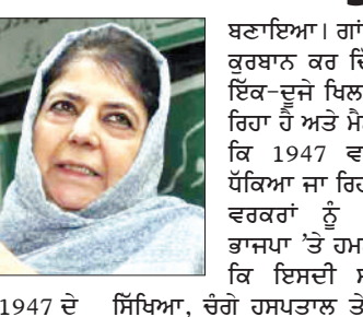
ਬਣਾਇਆ। ਗਾਂਧੀ ਨੇ ਤਾਂ ਜਾਨ ਵੀ ਕੁਰਬਾਨ ਕਰ ਦਿੱਤੀ। ਹੁਣ ਲੋਕਾਂ ਨੂੰ ਇੱਕ-ਦੂਜੇ ਖਿਲਾਫ ਭੜਕਾਇਆ ਜਾ ਰਿਹਾ ਹੈ ਅਤੇ ਮੌਨੂ ਭਰ ਲੱਗ ਰਿਹਾ ਹੈ ਕਿ 1947 ਵਰਗੀ ਸਥਿਤੀ ਵੱਲ ਧੱਕਿਆ ਜਾ ਰਿਹਾ ਹੈ। ਉਨ੍ਹਾਂ ਪਾਰਟੀ ਵਰਕਰਾਂ ਨੂੰ ਸੰਬੋਧਨ ਕਰਦਿਆਂ ਭਾਜਪਾ 'ਤੇ ਹਮਲਾ ਬੋਲਦਿਆਂ ਕਿਹਾ ਕਿ ਇਸਦੀ ਸਰਕਾਰ ਨੌਕਰੀਆਂ, ਸਿੱਖਿਆ, ਚੰਗੇ ਹਸਪਤਾਲ ਤੇ ਸੜਕਾਂ ਦੇਣ ਵਿੱਚ ਨਾਕਾਮ ਰਹੀ ਹੈ ਤੇ ਹੁਣ ਹੇਠਾਂ ਮੰਦਰ ਹੋਣ ਦੇ ਬਹਾਨੇ ਨਕਸਲਾ ਨੂੰ ਨਿਸ਼ਾਨਾ ਬਣਾ ਕੇ ਲੋਕਾਂ ਦਾ ਖਿਠਾ ਭੜਕਾ ਰਹੀ ਹੈ। ਉਨ੍ਹਾਂ ਕਿਹਾ—ਬੰਗਲਾਦੇਸ਼ ਵਿੱਚ ਸਾਡੇ ਹਿੰਦੂ ਭਰਾਵਾਂ 'ਤੇ ਜ਼ੁਲਮ ਹੋ ਰਿਹਾ ਹੈ ਪਰ ਜੇ ਅਸੀਂ ਇੱਕ ਘੱਟਗਿਣਤੀਆਂ ਨਾਲ ਉਹੀ ਸਲੂਕ ਕਰਾਂਗੇ ਤਾਂ ਫਿਰ ਫਰਕ ਕੀ ਰਿਹਾ ?

ਜੰਮੂ : ਪੀਪਲਜ਼ ਡੈਮੋਕਰੇਟਿਕ ਪਾਰਟੀ ਦੀ ਪ੍ਰਧਾਨ ਤੇ ਜੰਮੂ-ਕਸ਼ਮੀਰ ਦੀ ਸਾਬਕਾ ਮੁੱਖ ਮੰਤਰੀ ਮਹਿਬੂਬਾ ਮੁਫਤੀ ਨੇ ਐਤਵਾਰ ਦੇਸ਼ ਦੇ ਬਹੁਗਿਣਤੀ ਹਿੰਦੂਆਂ ਨੂੰ ਸੈਕੂਲਰ ਦੱਸਦਿਆਂ ਲੋਕਾਂ ਨੂੰ ਪਾਰਕਮ ਲੀਗਾਂ 'ਤੇ ਵੱਡਣ ਦੀ ਕੋਸ਼ਿਸ਼ ਕਰਨ ਵਾਲੀਆਂ ਤਾਕਤਾਂ ਖਿਲਾਫ ਮੁੜਹਿੰਦਾ ਲੜਾਈ ਦਾ ਸੱਦਾ ਦਿੱਤਾ। ਉਨ੍ਹਾਂ ਖਬਰਦਾਰ ਕੀਤਾ ਕਿ ਜੇ ਹੋ ਰਿਹਾ ਹੈ, ਉਸਤੋਂ ਹਾਲਾਤ 1947 ਦੇ ਫਸਾਦਾਂ ਵਰਗੇ ਬਣਦੇ ਦਿੱਸ ਰਹੇ ਹਨ। ਉਨ੍ਹਾਂ ਕਿਹਾ— ਦੇਸ਼ ਦੀ ਸਥਿਤੀ ਚੰਗੀ ਨਹੀਂ। ਮਹਾਤਮਾ ਗਾਂਧੀ, ਪੰਡਤ ਜਵਾਹਰ ਲਾਲ ਨਹਿਰੂ, ਮੌਲਾਨਾ ਅਬਦੁੱਲ ਕਲਾਮ ਆਜ਼ਾਦ, ਸਰਦਾਰ ਵੱਲਭਭਾਈ ਪਟੇਲ, ਬੀ ਆਰ ਅੰਬੇਡਕਰ ਵਰਗੇ ਆਗੂਆਂ ਨੇ ਇਸ ਦੇਸ਼ ਨੂੰ ਹਿੰਦੂਆਂ, ਮੁਸਲਮਾਨਾਂ, ਸਿੱਖਾਂ ਤੇ ਈਸਾਈਆਂ ਦਾ