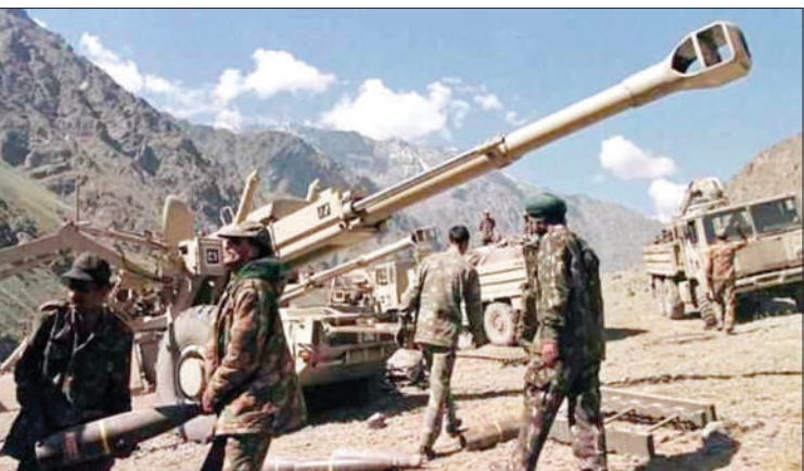
ਦੇਸ਼ ਵੀ ਖਾਸ ਕਰ ਦਿੱਤੇ ਸਨ। ਵੱਖੀ ਦੇਣ ਵਿੱਚ ਦਲਾਲ ਦੀ ਭੂਮਿਕਾ ਨਿਰਾਉਣ ਦੇ ਮੁਲਜ਼ਮ ਇਤਾਲਵੀ ਬਿਜ਼ਨਸਮੈਨ ਉਤਾਵਿਓ ਕੁਆਤਰੋਚੀ ਨੂੰ ਵੀ ਅਦਾਲਤ ਨੇ 2011 ਵਿੱਚ ਬਰੀ ਕਰ ਦਿੱਤਾ ਸੀ, ਜਦੋਂ ਉਸਨੇ ਸੀ ਬੀ ਆਈ ਨੂੰ ਉਸ ਵਿਰੁੱਧ ਮੁਕੱਦਮਾ ਵਾਪਸ ਲੈਣ ਦੀ ਆਗਿਆ ਦੇ ਦਿੱਤੀ ਸੀ।

ਨਵੀਂ ਦਿੱਲੀ : ਸੀ ਬੀ ਆਈ 1980ਵਿਆਂ ਦੇ 64 ਕਰੋੜੀ ਬੋਫਰਜ਼ ਵੱਲੋਂ ਸਕੈਂਡਲ ਬਾਰੇ ਨਿਜੀ ਜਾਂਚਕਰਤਾ ਮਾਈਕਲ ਹਰਸ਼ਮੈਨ ਤੋਂ ਜਾਣਕਾਰੀ ਹਾਸਲ ਕਰਨ ਲਈ ਅਮਰੀਕਾ ਨੂੰ ਫੋਟੀ ਹੀ ਅਦਾਲਤੀ ਬੇਨਤੀ ਭਿਜਵਾਉਣ ਦਾ ਇਰਾਦਾ ਰੱਖਦੀ ਹੈ। ਹਰਸ਼ਮੈਨ ਨੇ ਭਾਰਤੀ ਏਜੰਸੀਆਂ ਨਾਲ ਜਾਣਕਾਰੀ ਸਾਂਝੀ ਕਰਨ ਦੀ ਇੱਛਾ ਜ਼ਰੂਰੀ ਹੈ। ਸੀ ਬੀ ਆਈ ਨੇ ਇਸ ਮਾਮਲੇ ਦੀ ਅੱਗੇ ਜਾਣ ਲਈ ਉਸਦੀ ਅਪੀਲ 'ਤੇ ਸੁਣਵਾਈ ਕਰ ਰਹੀ ਵਿਸ਼ੇਸ਼ ਅਦਾਲਤ ਨੂੰ ਨਵੇਂ ਘਟਨਾਕ੍ਰਮ ਬਾਰੇ ਜਾਣੂ ਕਰਵਾਇਆ ਹੈ। ਅਮਰੀਕਾ ਨੂੰ ਲੋਟਰਜ਼ ਰੋਗੇਟਰੀ (ਐੱਲ ਆਰ) ਭੇਜਣ ਦੀ ਪ੍ਰਕਿਰਿਆ ਅਕਤੂਬਰ ਵਿੱਚ ਸ਼ੁਰੂ ਕੀਤੀ ਗਈ ਹੈ ਤੇ ਇਹ ਕਰੀਬ ਤਿੰਨ ਮਹੀਨਿਆਂ ਤੱਕ ਮੁਕੰਮਲ ਹੋ ਜਾਵੇਗੀ। ਲੋਟਰ ਰੋਗੇਟਰੀ 'ਚ ਜਾਂ ਵੈਬਸਾਈਟ ਮਾਮਲੇ ਵਿੱਚ ਮੁਕੱਦਮੇ 'ਚ ਸਹਿਯੋਗ ਲਈ ਇਕ ਦੇਸ਼ ਦੀ ਅਦਾਲਤ ਵੱਲੋਂ ਦੂਜੇ ਦੇਸ਼ ਦੀ ਅਦਾਲਤ ਨੂੰ ਭੇਜਿਆ ਜਾਂਦਾ ਹੈ। ਦਿੱਲੀ ਹਾਈ ਕੋਰਟ ਨੇ ਇਸ ਨਾਜ਼ੁਕ ਸਿਆਸੀ ਮਾਮਲੇ ਵਿੱਚ 2004 ਵਿੱਚ ਸਾਬਕਾ ਪ੍ਰਧਾਨ ਮੰਤਰੀ ਰਾਜੀਵ ਗਾਂਧੀ ਨੂੰ ਮਨੁੱਖੀ ਹਿੱਸੇ ਬਰੀ ਕਰ ਦਿੱਤਾ ਸੀ ਤੇ ਇਕ ਸਾਲ ਬਾਅਦ ਹਿੰਦੂਆਂ ਭਰਾਵਾਂ ਸਣੇ ਬਾਕੀ ਮੁਲਜ਼ਮਾਂ ਖਿਲਾਫ