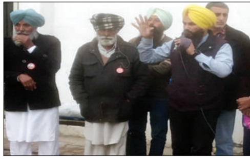
ਉਹ ਵਾਲ-ਵਾਲ ਬਚ ਗਏ, ਪਰ ਇੱਕ ਸਿੰਘ ਕਿਸਾਨ ਆਗੂ ਤਲਵੰਡੀ ਸਾਬੋ ਵੱਲੋਂ ਸੰਬੋਧਨ ਕੀਤਾ ਜਾਂਦਾ ਰਿਹਾ।