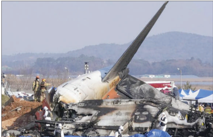
ਹਵਾਈ ਅੱਡੇ ਦੇ ਅਧਿਕਾਰੀਆਂ ਦੇ ਹਵਾਲੇ ਨਾਲ ਇੱਕ ਰਿਪੋਰਟ 'ਚ ਕਿਹਾ ਗਿਆ ਹੈ ਕਿ ਪਾਇਲਟ ਨੇ ਰੂਟੀਨ ਲੈਂਡਿੰਗ ਦੀ ਕੋਸ਼ਿਸ਼ ਨਾਕਾਮ ਹੋਣ ਤੋਂ ਬਾਅਦ ਕਰੋਸ਼ ਲੈਂਡਿੰਗ ਦੀ ਕੋਸ਼ਿਸ਼ ਕੀਤੀ। ਦੱਸਿਆ ਜਾ ਰਿਹਾ ਹੈ ਕਿ ਇੱਕ ਪੰਛੀ ਦੇ ਟਕਰਾਉਣ ਕਾਰਨ ਜਹਾਜ਼ ਦੀ ਲੈਂਡਿੰਗ 'ਚ ਦਿੱਕਤ ਆਈ। ਜਿਵੇਂ ਹੀ ਪੰਛੀ ਟਕਰਾਇਆ, ਜਹਾਜ਼ ਦਾ ਲੈਂਡਿੰਗ ਗੀਅਰ ਖਰਾਬ ਹੋ ਗਿਆ। ਜਹਾਜ਼ ਨੇ ਬਿਨਾਂ ਲੈਂਡਿੰਗ ਗੀਅਰ ਦੇ ਉਤਰਨ ਦੀ ਕੋਸ਼ਿਸ਼ ਕੀਤੀ ਅਤੇ ਫਿਸਲ ਗਿਆ।

ਸਿਓਲ : ਦੱਖਣੀ ਕੋਰੀਆ 'ਚ ਐਂਤਵਾਰ ਸਵੇਰੇ ਭਿਆਨਕ ਹਾਦਸੇ 'ਚ 179 ਲੋਕਾਂ ਦੀ ਮੌਤ ਹੋ ਗਈ, ਜਦੋਂ ਬੋਇੰਗ ਤੋਂ 181 ਲੋਕਾਂ ਨੂੰ ਲੈ ਕੇ ਆਇਆ ਜਹਾਜ਼ ਰਾਜਧਾਨੀ ਸਿਓਲ ਤੋਂ ਲੱਗਭੱਗ 290 ਕਿਲੋਮੀਟਰ ਦੱਖਣ 'ਚ ਮੁਆਨ ਏਅਰਪੋਰਟ 'ਤੇ ਉਤਰਨ ਵੇਲੇ ਹਨਾਵੇਅ ਤੋਂ ਫਿਸਲ ਕੇ ਕੰਧ ਨਾਲ ਟਕਰਾਅ ਗਿਆ।