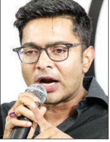
ਲੰਗਦਾ ਹੈ ਕਿ ਉਨ੍ਹਾਂ ਨੂੰ ਆਮ ਲੋਕਾਂ ਦੇ ਸੰਘਰਸ਼ਾਂ ਨਾਲ ਕੋਈ ਲੈਣਾ-ਦੇਣਾ ਨਹੀਂ।

ਕੋਲਕਾਤਾ : ਤ੍ਰਿਣਮੂਲ ਕਾਂਗਰਸ ਦੇ ਸਾਂਸਦ ਅਭਿਸ਼ੇਕ ਬੈਨਰਜੀ ਨੇ ਖੇਡ ਤੇ ਫਿਲਮ ਜਗਤ ਦੀਆਂ ਹਸਤੀਆਂ ਦੀ ਐਂਟਰਟੇਨਮੈਂਟ ਉਦਯੋਗੀ ਕੀਤੀ ਕਿ ਉਨ੍ਹਾਂ ਮਹਾਨ ਮੁਦੱਬਰ ਸਾਬਕਾ ਪ੍ਰਧਾਨ ਮੰਤਰੀ ਮਨਮੋਹਨ ਸਿੰਘ ਦੇ ਚਲਾਣੇ 'ਤੇ ਸਤਿਕਾਰ 'ਚ ਦੋ ਸ਼ਬਦ ਵੀ ਨਹੀਂ ਉਚਾਰੇ। ਉਨ੍ਹਾਂ ਕਿਹਾ ਕਿ ਲੰਗਦਾ ਹੈ ਕਿ ਸਰਕਾਰ ਤੋਂ ਡਰਦਿਆਂ ਨੇ ਖਾਮੋਸ਼ੀ ਅਖਤਿਆਰ ਕਰ ਲਈ। ਬੈਨਰਜੀ ਨੇ ਕਿਹਾ ਕਿ ਇਸ ਨੇ ਉਨ੍ਹਾਂ ਦੀਆਂ ਤਰਜੀਹਾਂ, ਜ਼ਿੰਮੇਵਾਰੀਆਂ ਤੇ ਦਿਆਨਤਦਾਰੀ 'ਤੇ ਸਵਾਲੀਆ ਨਿਸ਼ਾਨ ਲਾ ਦਿੱਤਾ ਹੈ। ਉਨ੍ਹਾਂ ਕਿਹਾ ਕਿ ਕੋਮੀ ਮੁੱਦਿਆਂ 'ਤੇ ਚੁੱਪ ਵੱਟ ਲੈਣੀ ਇਨ੍ਹਾਂ 'ਆਦਰਸ਼' ਦਾ ਨਮ ਹੀ ਬਣ ਗਿਆ ਹੈ। ਇਹ ਲੋਕ ਕਿਸਾਨ ਪ੍ਰਦੇਸ਼, ਸੀ ਏ ਏ-ਐੱਨ ਆਰ ਸੀ ਅੰਦੋਲਨ ਤੇ ਮਨੀਪੁਰ ਦੇ ਸੰਕਟ ਬਾਰੇ ਚੁੱਪ ਹੀ ਰਹੇ ਹਨ। ਚੜ੍ਹਾਉਣ, ਕਿਉਂਕਿ ਇਨ੍ਹਾਂ ਨੂੰ ਆਪਣੇ ਕੈਰੀਅਰ ਅਤੇ ਆਰਾਮ ਦੀ ਹੀ ਚਿੰਤਾ ਹੈ। ਇਨ੍ਹਾਂ ਦੀ ਬਾਂ ਲੋਕ ਉਨ੍ਹਾਂ ਦਾ ਸਤਿਕਾਰ ਕਰਨ, ਜਿਨ੍ਹਾਂ ਰਾਸ਼ਟਰ ਤੇ ਸਮਾਜ ਲਈ ਸੱਚ ਯੋਗਦਾਨ ਪਾਇਆ ਹੈ। ਉਹ ਉਨ੍ਹਾਂ ਦੀ ਕਦਰ ਪਾਉਣ, ਜਿਸਤੇ ਇਨਸਾਨ, ਜਮਹੂਰੀਅਤ ਤੇ ਰਾਸ਼ਟਰ ਦੇ ਭਲੇ ਲਈ ਖੜ੍ਹਦੇ ਹਨ।