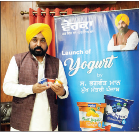
25 ਰੁਪਏ ਪ੍ਰਤੀ ਕਿਲੋ ਫੈਟ ਦਾ ਵਾਧਾ ਕੀਤਾ ਅਤੇ ਦੁੱਧ ਦੀ ਖਰੀਦ 840 ਰੁਪਏ ਪ੍ਰਤੀ ਕਿਲੋ ਫੈਟ ਦੇ ਮੁਤਾਬਕ ਕੀਤੀ ਜਾ ਰਹੀ ਹੈ। ਸਿਕਰਯੋਗ ਹੈ ਕਿ ਸੂਬੇ ਵਿੱਚ 6000 ਤੋਂ ਵੱਧ ਦੁੱਧ ਉਤਪਾਦਕ ਸਹਿਕਾਰੀ ਸਭਾਵਾਂ ਹਨ, ਜਿਨ੍ਹਾਂ ਕੋਲ 5 ਲੱਖ ਦੁੱਧ ਉਤਪਾਦਕ ਰਿਜਿਸਟਰਡ ਹਨ। ਬੁਲਾਰੇ ਨੇ ਦੱਸਿਆ ਕਿ ਮੁੱਖ ਮੰਤਰੀ ਨੇ ਵੇਰਕਾ ਡੇਅਰੀ ਲੁਧਿਆਣਾ ਵਿਖੇ ਨਵਾਂ ਪਲਾਂਟ ਲੋਕਾਂ ਨੂੰ ਸਮਰਪਿਤ ਕੀਤਾ, ਜਿਸ ਦੀ ਦੁੱਧ ਦੀ ਪ੍ਰੋਸੈਸਿੰਗ ਕਰਨ ਦੀ ਚੋਜਨਾ ਸਮਰੱਥਾ 9 ਲੱਖ ਲੀਟਰ ਹੈ ਅਤੇ ਇਹ ਪਲਾਂਟ 10 ਮੀਟਿਕ ਟਨ ਮੱਖਣ ਸੰਭਾਲਣ ਦੀ ਸਮਰੱਥਾ ਵੀ ਰੱਖਦਾ ਹੈ। ਇਸੇ ਤਰ੍ਹਾਂ ਵਿਰੋਧਪੁਰ ਵਿਖੇ ਵੇਰਕਾ ਡੇਅਰੀ ਪਲਾਂਟ ਵੀ ਮੁੱਖ ਮੰਤਰੀ ਨੇ ਲੋਕਾਂ ਨੂੰ ਸਮਰਪਿਤ ਕੀਤਾ, ਜੋ ਇੱਕ ਦਿਨ ਵਿੱਚ ਇੱਕ ਲੱਖ ਲੀਟਰ ਦੁੱਧ ਦੀ ਪ੍ਰੋਸੈਸਿੰਗ ਤੇ ਪੈਕਿੰਜਿੰਗ ਕਰਨ ਦੀ ਸਮਰੱਥਾ ਹੈ। ਇਸ ਤੋਂ ਇਲਾਵਾ ਦੁੱਧ ਤੋਂ ਬਣਨ ਵਾਲੇ ਪਦਾਰਥਾਂ ਦੇ ਯੂਨਿਟਾਂ ਦਾ ਵਿਸਥਾਰ ਕਰਨ ਦੇ ਉਦੇਸ਼ ਨਾਲ ਮੁੱਖ