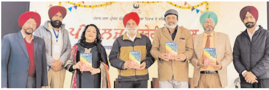
ਦੇ ਸ਼ੋਰ ਵਿੱਚ ਸ਼ਬਦਾਂ ਦੀ ਭਰਤੀ ਕੀਤੀ ਜਾਂਦੀ ਹੈ। ਉਹਨਾਂ ਆਖਿਆ ਕਿ ਗੀਤਕਾਰੀ ਅਤੇ ਗਾਇਕੀ ਬਾਰੇ ਅੰਜਨੀਆਂ ਸੰਜੀਦਾ ਗੋਸ਼ਟੀਆਂ ਦੀ ਲੋੜ ਹੈ। ਇਸ ਸੰਬੰਧ ਵਿੱਚ ਉਹਨਾਂ ਅਨੇਕਾਂ ਗੱਲਾਂ ਦੇ ਪਿਛੋਕੜ ਬਾਰੇ ਚਰਚਾ ਕੀਤੀ।