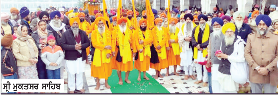
ਸ੍ਰੀ ਮੁਕਤਸਰ ਸਾਹਿਬ