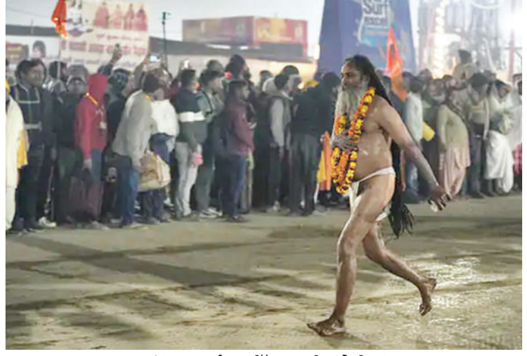
ਭਗਦਤ ਮਚਣ ਤੋਂ ਬਾਅਦ ਸੰਗਮ ਵਿੱਚ ਭੁਬਕੀ ਲਾਏ ਬਿਨਾਂ ਮੁੜਦਾ ਸਾਧੂ।