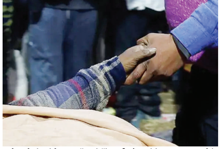
ਸਰੋਵਰ 'ਚ ਵੀ ਸਾਥੀ ਨੇ ਲਾਭ ਦਾ ਹੱਥ ਨਹੀਂ ਛੱਡਿਆ। ਉਸ ਨੂੰ ਭਰ ਸੀ ਕਿ ਲਾਭ ਗੁਆਚ ਨਾ ਜਾਵੇ!