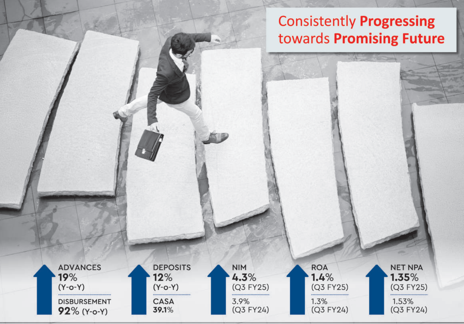
Extract of Unaudited Financial Results for the quarter and nine months ended December 31, 2024