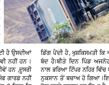
ਭਿੰਗ ਪੱਟੀ ਹੈ, ਪੁਸ਼ਕਿਸ਼ਮਾਤੀ ਕਿ ਅਜੇ ਨਹਿਰ ਵਿੱਚ ਪਾਣੀ ਬੰਦ ਹੋਵੇਗਾ ਤਾਂ ਇਹ ਪਿੰਡ ਅਜਨਬੀ ਦੇ ਨਜ਼ਦੀਕ ਕੋਰੋਸ ਨਾਲ ਭਰਿਆ ਇੱਕ ਨਹਿਰ ਵਿੱਚ ਪਲਟਿਆ, ਡਾਕੇ ਜਾਨੀ ਨੁਕਸਾਨ ਤੋਂ ਬਚਾਅ ਹੋ ਗਿਆ। ਇਸ ਨਹਿਰ ਦੇ ਬੰਦ ਹੋਣ ਨਾ ਹੋਣ ਕਰਕੇ ਹਾਦਿਸਾ ਵਾਪਰਿਆ ਹੈ, ਨਵਾਂ ਰੋਡ ਬਣਿਆ ਹੋਣ ਕਰਕੇ ਸੜਕ ਬਹੁਤ ਚੜ੍ਹਦੀ ਚਲਦੀ ਹੈ। ਨਹਿਰ ਵਾਲੇ ਪਾਸੇ ਬਰਮ ਲਈ ਬਿਲਕੁਲ ਵੀ ਜਗ੍ਹਾ ਨਹੀਂ ਹੈ। ਸਰਕਾਰ ਇਸ ਸੜਕ ਵੱਲ ਧਿਆਨ ਦੇਵੇ।

ਦਾ ਜਮਘਟਾ ਲੱਗਾ ਰਹਿੰਦਾ ਹੈ ਜਿਨ੍ਹਾਂ 'ਤੇ ਹਮੇਸ਼ਾ ਹਾਦਿਸੇ ਦਾ ਖਤਰਾ ਮੰਡਰਾ ਰਿਹਾ ਹੈ। ਨਵੀਂ ਸੜਕ ਹੋਣ ਕਾਰਨ ਵਹੀਕਲਾਂ ਦੀ ਸਪੀਡ ਵਧ ਗਈ ਹੈ ਅਤੇ ਲਗਾਤਾਰ ਹਾਦਿਸੇ ਵਾਪਰਨ ਲੱਗ ਪਏ ਹਨ, ਨਿੱਤ ਦਿਨ ਕੋਈ ਨਾ ਕੋਈ ਗੱਡੀ ਨਹਿਰ ਵਿੱਚ