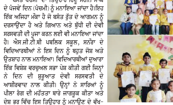
ਬਸੰਤ ਪੰਚਮੀ ਦਾ ਤਿਉਹਾਰ ਹਿੰਦੂ ਮਹੀਨੇ ਮਾਘ ਦੇ ਪੰਜਵੇਂ ਦਿਨ (ਪੰਚਮੀ) ਨੂੰ ਮਨਾਇਆ ਜਾਂਦਾ ਹੈ। ਇਹ ਇੱਕ ਅਜਿਹਾ ਮੌਕਾ ਹੈ ਜੋ ਬਸੰਤ ਰੁੱਤ ਦੇ ਆਗਮ ਨੂੰ ਦਰਸਾਉਂਦਾ ਹੈ ਅਤੇ ਗਿਆਨ ਅਤੇ ਬੁੱਧੀ ਦੀ ਦੇਵੀ ਸਰਸਵਤੀ ਦੀ ਪੂਜਾ ਕਰਨ ਲਈ ਵੀ ਮਨਾਇਆ ਜਾਂਦਾ ਹੈ। ਐੱਸ.ਜੀ.ਟੀ.ਬੀ ਪਬਲਿਕ ਸਕੂਲ, ਸਨੌਰਾ ਦੇ ਵਿਦਿਆਰਥੀਆਂ ਨੇ ਇਸ ਦਿਨ ਨੂੰ ਬਹੁਤ ਜੋਸ਼ ਅਤੇ ਉਤਸ਼ਾਹ ਨਾਲ ਮਨਾਇਆ। ਵਿਦਿਆਰਥੀਆਂ ਦੁਆਰਾ ਇੱਕ ਵਿਸ਼ੇਸ਼ ਵਰਚੁਅਲ ਸਭਾ ਪੇਸ਼ ਕੀਤੀ ਗਈ ਜਿਨ੍ਹਾਂ ਨੇ ਦਿਨ ਦੀ ਸ਼ੁਰੂਆਤ ਦੇਵੀ ਸਰਸਵਤੀ ਦੇ ਆਸ਼ੀਰਵਾਦ ਨਾਲ ਕੀਤੀ। ਉਨ੍ਹਾਂ ਨੇ ਸਾਹਿਬਾਂ ਨੂੰ ਪੀਲੀ ਰੰਗ ਦੀ ਮਹਿੰਤਾ ਬਾਰੇ ਜਾਗਰੂਕ ਕੀਤਾ ਅਤੇ ਦੇਸ਼ ਭਰ ਵਿੱਚ ਇਸ ਤਿਉਹਾਰ ਨੂੰ ਮਨਾਉਣ ਦੇ ਵੱਖ-ਵੱਖ ਤਰੀਕਿਆਂ ਬਾਰੇ ਦੱਸਿਆ। ਵਰਚੁਅਲ ਕਲਾਸਰੂਮਾਂ ਵਿੱਚ ਦਿਨ ਮਨਾਉਣ ਲਈ, ਕਲਾਵਾਂ ਵਿੱਚ ਵੱਖ-ਵੱਖ ਗਤੀਵਿਧੀਆਂ ਦਾ ਆਯੋਜਨ ਕੀਤਾ ਗਿਆ। ਵਿਦਿਆਰਥੀਆਂ ਅਤੇ ਅਧਿਆਪਕਾਂ ਨੇ ਪੀਲੇ ਰੰਗ ਦੇ ਪਹਿਰਾਵੇ ਪਹਿਨੇ ਹੋਏ ਸਨ। ਸਕੂਲ ਦੇ ਫੁੱਲਾਂ ਦੇ ਖਿੜਨ ਅਤੇ ਬਸੰਤ ਦੇ ਆਗਮ ਬਾਰੇ ਵੀ ਵਿਸ਼ੇਸ਼ ਗੱਲਾਂ ਦੱਸਿਆ ਗਿਆ। ਨਸ਼ਰੀ ਦੇ ਵਿਦਿਆਰਥੀਆਂ ਨੇ ਇੱਕ ਕਾਰਡ ਬਣਾਉਣ ਦੀ ਗਤੀਵਿਧੀ ਦਾ ਆਨੰਦ ਮਾਇਆ ਜਿਸ ਵਿੱਚ ਉਨ੍ਹਾਂ ਨੇ ਕਾਲ ਦੇ ਫੁੱਲ ਨੂੰ ਪੇਂਟ ਕੀਤਾ ਅਤੇ ਦੇਵੀ ਸਰਸਵਤੀ ਦੇ ਸੰਗਤ ਯੋਤ ਨੂੰ ਸਜਾਇਆ। ਸਕੂਲ ਦੀ ਪ੍ਰਿੰਸੀਪਲ