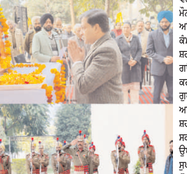
ਗੁਰਦਾਸਪੁਰ, (ਜਨਕ ਮਹਾਸਨ)

ਚੋਂ ਦੇ ਸੁਤੰਤਰਤਾ ਸੰਗਰਾਮ ਦੌਰਾਨ ਆਪਣੀਆਂ ਜਾਨਾਂ ਦੇਣ ਕੇਮ ਲਈ ਵਾਰਨ ਵਾਲੇ ਸ਼ਹੀਦਾਂ ਦੀ ਯਾਦ ਵਿੱਚ ਜ਼ਿਲ੍ਹਾ ਸਦਕ ਮੁਕਾਮ ਗੁਰਦਾਸਪੁਰ ਵਿਖੇ ਸਮੂਹ ਵਿਭਾਗਾਂ ਦੇ ਅਧਿਕਾਰੀਆਂ, ਕਰਮਚਾਰੀਆਂ, ਪੁਲਿਸ ਜਵਾਨਾਂ ਅਤੇ ਆਮ ਜਨਤਾ ਨੇ 2 ਮਿਟ ਦਾ ਮੌਨ ਧਾਰਨ ਕਰਕੇ ਸ਼ਹੀਦਾਂ ਨੂੰ ਅਤੇ ਭਾਰਤ ਦੀ ਸਮਰੱਥਾ ਨਿਰਮਾਣ ਵਿੱਚ ਨਿੱਜੀ ਖੇਤਰ ਦੀ ਸਿੱਧੇਦਾਰੀ ਨੂੰ ਉਤਸ਼ਾਹਿਤ ਕਰਨ ਲਈ ਤਿਆਰ ਕੀਤੀ ਗਈ ਹੈ।