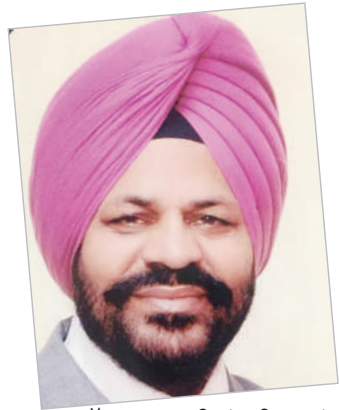
ਮੱਖਣ ਮਾਨ ਦੀਆਂ ਕਵਿਤਾਵਾਂ (ਆਖਰੀ ਤੋਂ ਪਹਿਲੇ ਸਫ਼ੇ 'ਤੇ)