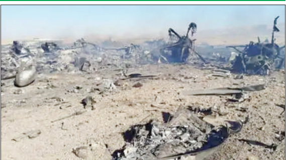
ਈਰਾਨੀ ਸੰਸਦ ਦੇ ਸਪੀਕਰ ਵੱਲੋਂ ਅਮਰੀਕੀ ਜਹਾਜ਼ ਦੇ ਮਲਬੇ ਦੀ ਸਾਂਝੀ ਕੀਤੀ ਗਈ ਤਸਵੀਰ।