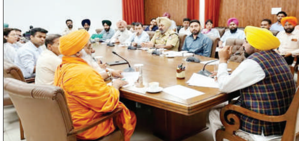
ਮੁੱਖ ਮੰਤਰੀ ਜਿਨ੍ਹਾਂ ਦੇ ਨਾਲ ਰਾਜ ਸਭਾ ਮੈਂਬਰ ਸੰਤ ਬਲਬੀਰ ਸਿੰਘ ਸੀਚੋਵਾਲ ਵੀ ਸਨ, ਨੇ ਪੰਜਾਬ ਭਰ ਵਿੱਚ ਹੜ੍ਹ ਸੁਰੱਖਿਆ ਕਾਰਜਾਂ ਨੂੰ