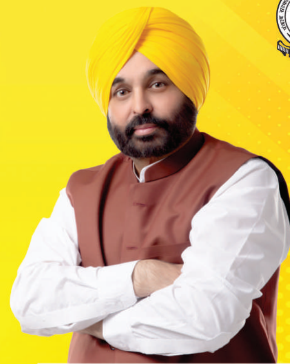
ਸ. ਭਗਵੰਤ ਸਿੰਘ ਮਾਨ ਮੁੱਖ ਮੰਤਰੀ, ਪੰਜਾਬ