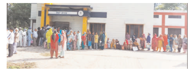
ਗੜ੍ਹਸ਼ੰਕਰ (ਫੁਲਾ ਸਿੰਘ ਬੀਰਮੁਖਰ) ਪੰਜਾਬ ਸਰਕਾਰ ਨੇ ਅੰਗਰਾਂ ਨੂੰ 1000 ਤੋਂ 1500 ਰੁਪਏ ਦੇਣ ਦੀ ਘੋਸ਼ਣਾ ਕੀਤੀ ਹੈ ਉਦੋਂ ਤੋਂ ਹੀ ਸੂਬਾ ਸਰਕਾਰ ਦੇ ਸੇਵਾ ਕੇਂਦਰਾਂ ਵਿੱਚ 18 ਸਾਲ ਤੋਂ ਵੱਧ ਉਮਰ ਦੀ ਅੰਗਰਾਂ ਦੀਆਂ ਲੰਬੀਆਂ ਲਾਈਨਾਂ ਲੱਗ ਰਹੀਆਂ ਹਨ।

ਵਿਧਾਨ ਸਭਾ ਹਲਕਾ ਗੜ੍ਹਸ਼ੰਕਰ ਦੇ ਅਧਿਕਾਰ ਆਉਂਦੇ ਸੇਵਾ ਕੇਂਦਰਾਂ ਵਿੱਚ ਜਾਣੀ ਤੇ ਰਿਹਾਇਸ਼ੀ ਪੁੰਮਾਟ ਪੱਤਰ ਬਣਾਉਣ ਵਾਲਿਆਂ ਦੀ ਭਾਰੀ ਭੀੜ ਦੱਖਣ ਨੂੰ ਮਿਲ ਰਹੀਆਂ ਹਨ। ਲੋਕ ਆਪੋ-ਆਪਣੇ ਕੰਮ ਪੈਦੇ ਛੱਡ ਕੇ ਸਵੇਰ 6 ਵਜੇ ਤੋਂ ਹੀ ਸੇਵਾ ਕੇਂਦਰਾਂ ਦੀਆਂ ਲਾਈਨਾਂ ਵਿੱਚ ਲੱਕੜੇ ਮਾਰਨ ਤੋਂ ਜਾਤੀ ਪੁੰਮਾਟ ਪੱਤਰ ਬਣਾਉਣ ਦੀ ਪੁਕਰਿਆ ਨੂੰ ਸਹਲ ਕੀਤਾ ਜਾਵੇ।