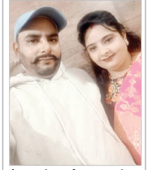
ਮੰਗਾ ਭਾਈਆਂ ਅਤੇ ਮਮਤਾ ਭਾਈਆਂ ਵਾਸੀ ਕਾਦੀਆਂ ਨੇ ਆਪਣੇ ਵਿਆਹ ਦੀ 23ਵੀਂ ਵਰ੍ਹੇਗੰਢ ਮਨਾਈ।