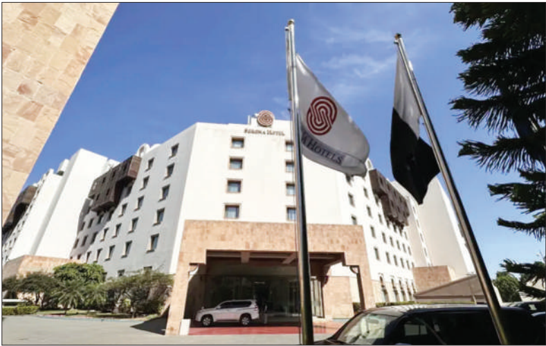
ਇਸਲਾਮਾਬਾਦ ਦਾ ਸੋਨੇਨਾ ਹੋਟਲ, ਜਿੱਥੇ ਅਮਰੀਕਾ ਤੇ ਈਰਾਨ ਵਿਚਾਲੇ ਗੱਲਬਾਤ ਹੋਣ ਦੀ ਉਮੀਦ ਸੀ।

ਇਸਲਾਮਾਬਾਦ : ਅਮਰੀਕੀ ਰਾਸ਼ਟਰਪਤੀ ਡੋਨਾਲਡ ਟਰੰਪ ਨੇ ਸੋਮਵਾਰ ਪਾਕਿਸਤਾਨੀ ਆਰਮੀ ਚੀਫ਼ ਆਸਿਮ ਮੁਨੀਰ ਨਾਲ ਗੱਲਬਾਤ ਕੀਤੀ, ਜਿਸ ਵਿੱਚ ਮੁਨੀਰ ਨੇ ਕਿਹਾ ਕਿ ਅਮਰੀਕਾ ਨੇ ਹਾਮਲਾ ਜਲੜਮੂੜ ਦੀ ਨਾਕਾਬੰਦੀ ਖਤਮ ਨਾ ਕੀਤੀ ਤਾਂ ਈਰਾਨ ਨਾਲ ਗੱਲ ਹੋਣੀ ਮੁਸ਼ਕਲ ਹੈ। ਪਾਕਿਸਤਾਨੀ ਰੱਖਿਆ ਸੂਤਰ ਮੁਤਾਬਕ ਟਰੰਪ ਨੇ ਕਿਹਾ ਕਿ ਉਹ ਇਸ ‘ਤੇ ਵਿਚਾਰ ਕਰਨਗੇ। ਸੂਤਰ ਮੁਤਾਬਕ ਦੋਹਾਂ ਵਿਚਾਲੇ ਇਸ ਮੁੱਦੇ ‘ਤੇ ਵਿਸ਼ਾਖ ਵੱਲੋਂ ਚਰਚਾ ਹੋਈ। ਈਰਾਨ ਨੇ ਅਮਰੀਕਾ ਵੱਲੋਂ ਉਸ ਦੇ ਜਹਾਜ਼ ਟੁਕੜਾ ਨੂੰ ਕਬਜ਼ੇ ਵਿੱਚ ਲੈਣ ‘ਤੇ ਸਖ਼ਤ ਨਾਕਾਬੰਦੀ ਜਤਾਈ ਹੈ ਤੇ ਇਸ ਨੂੰ ਸਮੁੰਦਰੀ ਡਾਕਾ ਕਰਾਰ ਦਿੰਦਿਆਂ ਛੇਤੀ ਹੀ ਜਵਾਬ ਦੇਣ ਦੀ ਗੱਲ ਕਹੀ ਹੈ। ਉਪਰ, ਖ਼ਾੜੀ ਦੇ ਪ੍ਰਸਿੱਧ ਚੈਨਲ ਅਲ ਜਜੀਰਾ ਨੇ ਕਿਹਾ ਹੈ ਕਿ ਈਰਾਨ ਤੇ ਅਮਰੀਕਾ ਵਿਚਾਲੇ ਹੋਣ ਵਾਲੀ ਗੱਲਬਾਤ ਕਈ ਦਿਨ ਚੱਲ ਸਕਦੀ ਹੈ। ਕੋਸ਼ਿਸ਼ ਇਹੀ ਹੈ ਕਿ ਇੱਕ