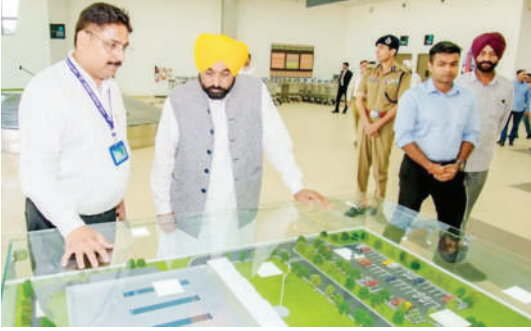
ਹਲਵਾਰਾ (ਨਵਾਂ ਜ਼ਮਾਨਾ ਸਰਵਿਸ)

ਅੱਡੇ ਦੇ ਵਿਕਾਸ 'ਤੇ ਪੰਜਾਬ ਸਰਕਾਰ ਨੇ 54 ਕਰੋੜ ਤੋਂ ਵੱਧ ਖਰਚ ਕੀਤੇ