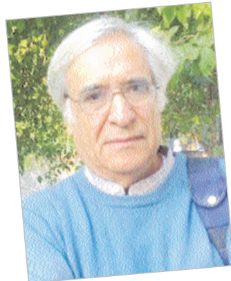
ਅਵਤਾਰ ਉੱਪਲ ਫਿਰ ਆਉਣਾ! (ਆਖਰੀ ਸਥੇ 'ਤੇ)