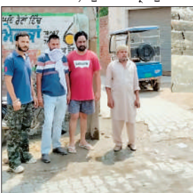
ਸਾਹਿਬ ਵਿੱਚ ਵਿਗੜ ਰਹੀ ਲਾਅ ਐਂਡ ਆਰਡਰ ਦੀ ਸਥਿਤੀ ਨੂੰ ਪੁਲਿਸ ਪ੍ਰਬੰਧਨ ਦੀ ਕਾਰਗੁਜ਼ਾਰੀ 'ਤੇ ਸਵਾਲ ਖੜ੍ਹ ਕਰ ਦਿੱਤੇ ਹਨ।

ਉਨ੍ਹਾਂ ਦੱਸਿਆ ਕਿ ਘਟਨਾ ਦੀ ਸੂਚਨਾ ਤੁਰੰਤ ਬਾਣਾ ਸਿਟੀ ਪੁਲਿਸ ਨੂੰ ਦਿੱਤੀ ਗਈ, ਜਿਸ ਤੋਂ ਬਾਅਦ ਪੁਲਿਸ ਨੇ ਮੌਕੇ 'ਤੇ ਪਹੁੰਚ ਕੇ ਜਾਂਚ ਸ਼ੁਰੂ ਕਰ ਦਿੱਤੀ ਹੈ।