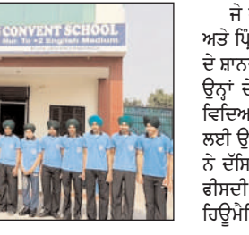
ਅੰਮ੍ਰਿਤਸਰ ਵਿੱਚ ਸਕੂਲ ਵਿਦਿਆਰਥੀਆਂ ਨੂੰ ਸ਼ਾਨਦਾਰ ਪ੍ਰਦਰਸ਼ਨ ਕੀਤਾ ਗਿਆ।

ਕਿਹਾ ਕਿ ਜਿੰਦਗੀ ਵਿੱਚ ਸਫਲਤਾ ਸਿਰਫ ਚੰਗੇ ਅੰਕ ਹਾਸਲ ਕੀਤੀਆਂ ਨਹੀਂ, ਸਗੋਂ ਮਿਹਨਤ, ਅਨੁਸ਼ਾਸਨ ਅਤੇ ਚੰਗੇ ਸੰਸਕਾਰਾਂ ਨਾਲ ਮਿਲਦੀ ਹੈ। ਉਨ੍ਹਾਂ ਵਿਦਿਆਰਥੀਆਂ ਨੂੰ ਆਪਣੇ ਸੁਪਨਿਆਂ ਨੂੰ ਉੱਚਾ ਰੱਖਣ ਅਤੇ ਜਿੰਦਗੀ ਵਿੱਚ ਹਮੇਸ਼ਾ ਅੱਗੇ ਵਧਣ ਲਈ ਪ੍ਰੇਰਿਤ ਕੀਤਾ। ਇਸ ਮੌਕੇ ਸਕੂਲ ਪ੍ਰਬੰਧਕ ਕਮੇਟੀ, ਅਧਿਆਪਕਾਂ ਅਤੇ ਮਾਪਿਆਂ ਨੇ ਵੀ ਵਿਦਿਆਰਥੀਆਂ ਦੀ ਵਿਲੱਖਣ ਪ੍ਰਾਪਤੀ 'ਤੇ ਖੁਸ਼ੀ ਪ੍ਰਗਟਾਈ।