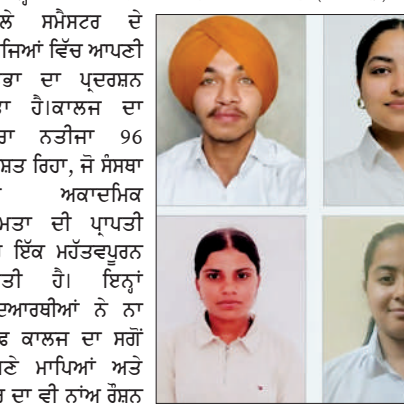
ਗੁਰੂ ਗੋਬਿੰਦ ਸਿੰਘ ਲਾਅ ਕਾਲਜ ਦੇ ਵਿਦਿਆਰਥੀਆਂ ਨੇ ਪੰਜਾਬ ਯੂਨੀਵਰਸਿਟੀ ਚੰਡੀਗੜ੍ਹ ਵੱਲੋਂ ਐਲਾਨੇ ਗਏ ਬੀਏ ਐਲਾਨਬੀ (ਆਨਰਜ਼) ਪਹਿਲੇ ਸੈਮੇਸਟਰ ਦੇ ਨਤੀਜਿਆਂ ਵਿੱਚ ਆਪਣੀ ਪ੍ਰਤਿਭਾ ਦਾ ਪ੍ਰਦਰਸ਼ਨ ਕੀਤਾ ਹੈ।

ਗਿੱਦੜਬਾਗ (ਜਸਵੰਤ ਗਿੱਲ ਛੱਤਿਆਣਾ) ਗੁਰੂ ਗੋਬਿੰਦ ਸਿੰਘ ਲਾਅ ਕਾਲਜ ਦੇ ਵਿਦਿਆਰਥੀਆਂ ਨੇ ਪੰਜਾਬ ਯੂਨੀਵਰਸਿਟੀ ਚੰਡੀਗੜ੍ਹ ਵੱਲੋਂ ਐਲਾਨੇ ਗਏ ਬੀਏ ਐਲਾਨਬੀ (ਆਨਰਜ਼) ਪਹਿਲੇ ਸੈਮੇਸਟਰ ਦੇ ਨਤੀਜਿਆਂ ਵਿੱਚ ਆਪਣੀ ਪ੍ਰਤਿਭਾ ਦਾ ਪ੍ਰਦਰਸ਼ਨ ਕੀਤਾ ਹੈ।