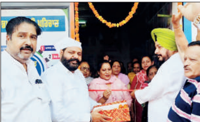
ਧਰਮਸੋਤ ਨੇ ਆਪਣੇ ਕਰ ਕਮਲਾਂ ਨਾਲ ਕੀਤਾ। ਇਸ ਤੋਂ ਪਹਿਲਾਂ ਸ਼੍ਰੀ ਰਮਾਇਣ ਦਾ ਪਾਠ ਕੀਤਾ ਗਿਆ, ਉਹਨਾਂ ਵਾਰਡ ਨੰਬਰ 7 ਬੰਨੀਆ ਮੁਹੱਲਾ ਵਿੱਚ ਦਫ਼ਤਰ ਦਾ ਉਦਘਾਟਨ ਕੀਤਾ ਗਿਆ।

ਉਨ੍ਹਾਂ ਦੱਸਿਆ ਕਿ ਘਟਨਾ ਦੀ ਸੂਚਨਾ ਤੁਰੰਤ ਬਾਣਾ ਸਿਟੀ ਪੁਲਿਸ ਨੂੰ ਦਿੱਤੀ ਗਈ, ਜਿਸ ਤੋਂ ਬਾਅਦ ਪੁਲਿਸ ਨੇ ਮੌਕੇ 'ਤੇ ਪਹੁੰਚ ਕੇ ਜਾਂਚ ਸ਼ੁਰੂ ਕਰ ਦਿੱਤੀ ਹੈ।