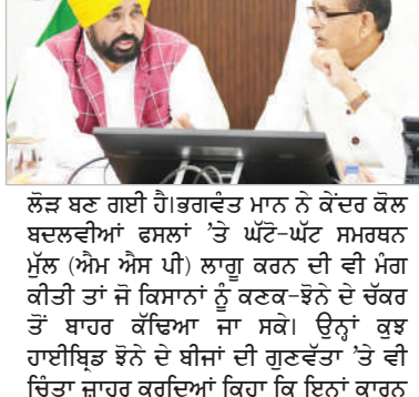
ਲੋੜ ਬਣ ਗਈ ਹੈ। ਭਗਵੰਤ ਮਾਨ ਨੇ ਕੇਂਦਰ ਕੋਲ ਬਦਲਵੀਆਂ ਫਸਲਾਂ ‘ਤੇ ਘੱਟ-ਘੱਟ ਸਮਰਥਨ

ਨਵੀਂ ਦਿੱਲੀ : ਪੰਜਾਬ ਦੇ ਮੁੱਖ ਮੰਤਰੀ ਭਗਵੰਤ ਸਿੰਘ ਮਾਨ ਨੇ ਕੇਂਦਰੀ ਖੇਤੀਬਾੜੀ ਮੰਤਰੀ ਸ਼ਿਵਰਾਜ ਸਿੰਘ ਚੌਹਾਨ ਨਾਲ ਮੁਲਾਕਾਤ ਕਰਕੇ ਸੂਬੇ ਦੇ ਕਿਸਾਨਾਂ ਨਾਲ ਜੁੜੇ ਅਹਿਮ ਮੁੱਦੇ ਉਠਾਏ। ਮੀਟਿੰਗ ਦੌਰਾਨ ਕੇਂਦਰ ਵੱਲੋਂ ਪੰਜਾਬ ਵਿੱਚ ਖਾਦਾਂ ਦੀ ਨਿਰਵਿਧਨ ਸਪਲਾਈ ਅਤੇ ਸਾਉਣੀ ਸੀਸ਼ਨ ਦੌਰਾਨ ਪ੍ਰਾਪਤ ਖਰੀਦ ਪ੍ਰਬੰਧਾਂ ਦਾ ਭਰੋਸਾ ਦਿੱਤਾ ਗਿਆ। ਮੁੱਖ ਮੰਤਰੀ ਨੇ ਕਿਹਾ ਕਿ ਪੰਜਾਬ ਸਰਕਾਰ ਝੋਨੇ ਦੇ ਬਜਾਏ ਮੱਕੀ, ਦਾਲਾਂ, ਤੇਲ ਵਾਲੇ ਬੀਜ, ਸੂਰਜਮੁਖੀ ਅਤੇ ਬਾਜਰੇ ਵਰਗੀਆਂ ਬਦਲਵੀਆਂ ਫਸਲਾਂ ਨੂੰ ਉਤਸ਼ਾਹਿਤ ਕਰੇਗੀ ਤਾਂ ਜੋ ਪਰਤੀ ਹੇਠਲੇ ਪਾਣੀ ਦੀ ਬਚਤ ਕੀਤੀ ਜਾ ਸਕੇ। ਉਨ੍ਹਾਂ ਦੱਸਿਆ ਕਿ ਸੂਬੇ ਦੇ 150 ਵਿੱਚੋਂ 117 ਬਲਾਕ ਡਾਰਕ ਜੌਨ ਵਿੱਚ ਪਹੁੰਚ ਚੁੱਕੇ ਹਨ, ਜਿਸ ਕਾਰਨ ਫਸਲੀ ਵਿਭਿੰਨਤਾ ਸਮੇਂ ਦੀ