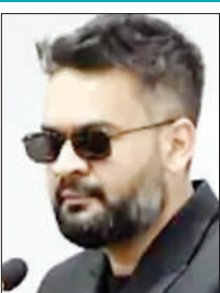
ਜਦੋਂ ਅੰਗਰੇਜ਼ਾਂ ਦਾ ਰਾਜ ਸੀ। ਕਠਮੰਡੂ ਦੇ ਮੇਅਰ ਵਜੋਂ ਸੇਵਾ ਨਿਭਾਉਂਦੇ ਹੋਏ ਬਾਲੇਨ ਸ਼ਾਹ ਨੇ ਆਪਣੇ ਦਫਤਰ ਵਿੱਚ ਗੁੱਟਰ ਨੇਪਾਲ ਦਾ ਇੱਕ ਨਕਸ਼ਾ ਪ੍ਰਦਰਸ਼ਤ ਕੀਤਾ ਸੀ। ਇਸ ਵਿੱਚ ਹਿਮਾਚਲ ਪ੍ਰਦੇਸ਼ ਦੇ ਪੱਛਮੀ ਕਾਂਗੜਾ ਤੋਂ ਪੱਛਮੀ ਬੰਗਾਲ ਵਿੱਚ ਪੂਰਬੀ ਤੀਸਤਾ ਨਦੀ ਤੱਕ ਦੇ ਖੇਤਰ ਨੂੰ ਗੁੱਟਰ ਨੇਪਾਲ ਦੇ ਹਿੱਸੇ ਵਜੋਂ

ਕਠਮੰਡੂ (ਨਵਾਂ ਜ਼ਮਾਨਾ ਸਰਵਿਸ) ਨੇਪਾਲ ਦੇ ਪ੍ਰਧਾਨ ਮੰਤਰੀ ਬਾਲੇਨ ਸ਼ਾਹ ਨੇ ਭਾਰਤ-ਨੇਪਾਲ ਸਰਹੱਦੀ ਵਿਵਾਦ 'ਤੇ ਵੱਡਾ ਬਿਆਨ ਦਿੱਤਿਆ ਕਿਹਾ ਕਿ ਭਾਰਤ ਨੇ ਹੀ ਨੇਪਾਲੀ ਜ਼ਮੀਨ 'ਤੇ ਕਬਜ਼ਾ ਨਹੀਂ ਕੀਤਾ, ਨੇਪਾਲ ਨੇ ਵੀ ਕਈ ਭਾਰਤੀ ਇਲਾਕਿਆਂ 'ਤੇ ਕਬਜ਼ਾ ਕੀਤਾ ਹੈ। ਅੰਤਵਾਰ ਸੰਸਦ ਵਿੱਚ ਇੱਕ ਸਵਾਲ ਦੇ ਜਵਾਬ ਵਿੱਚ ਸ਼ਾਹ ਨੇ ਕਿਹਾ, 'ਮੈਨੂੰ ਪ੍ਰਧਾਨ ਮੰਤਰੀ ਬਣਨ ਤੋਂ ਬਾਅਦ ਇਸ ਬਾਰੇ ਪਤਾ ਲੱਗਾ। ਦੋਵਾਂ ਦੇਸ਼ਾਂ ਨੂੰ ਇਕੱਠੇ ਬੈਠ ਕੇ ਇਸ ਮਾਮਲੇ ਦੀ ਜਾਂਚ ਕਰਨੀ ਚਾਹੀਦੀ ਹੈ।' ਲਿਪੁਲੇਖ ਅਤੇ ਲਿੰਪੀਆਪੁਰਾ ਰਾਹੀਂ ਭਾਰਤ ਅਤੇ ਚੀਨ ਵਿਚਕਾਰ ਵਪਾਰ ਬਾਰੇ ਇੱਕ ਸਵਾਲ ਦੇ ਜਵਾਬ ਵਿੱਚ ਸ਼ਾਹ ਨੇ ਕਿਹਾ ਕਿ ਵਿਵਾਦਾਂ ਨੂੰ ਕੂਟਨੀਤਕ ਗੱਲਬਾਤ ਰਾਹੀਂ ਹੱਲ ਕੀਤਾ ਜਾਵੇਗਾ। ਉਨ੍ਹਾਂ ਕਿਹਾ ਕਿ ਨੇਪਾਲ ਪਹਿਲਾਂ ਹੀ ਭਾਰਤ ਨੂੰ ਇੱਕ