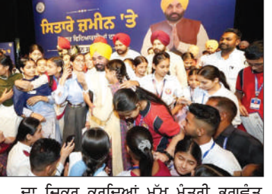
ਦਾ ਜ਼ਿਕਰ ਕਰਦਿਆਂ ਮੁੱਖ ਮੰਤਰੀ ਭਗਵੰਤ ਸਿੰਘ ਮਾਨ ਨੇ ਕਿਹਾ ਕਿ ਸੂਬੇ ਦੀ 'ਸਿੱਖਿਆ ਕ੍ਰਾਂਤੀ' ਦੇ ਜ਼ਮੀਨੀ ਪੱਧਰ 'ਤੇ ਸਾਰਥਕ ਨਤੀਜੇ ਸਾਹਮਣੇ ਆਉਣੇ ਸ਼ੁਰੂ ਹੋ ਗਏ ਹਨ। ਅੰਤਵਾਰ ਇੱਥੇ ਟੈਗੋਰ

ਪੰਜਾਬ ਦੇ ਸਿੱਖਿਆ ਢਾਂਚੇ ਵਿੱਚ ਇਨਕਲਾਬੀ ਬਦਲਾਅ ਲਿਆਉਣ ਦੇ ਚਾਰ ਸਾਲਾਂ ਬਾਅਦ ਭਗਵੰਤ ਸਿੰਘ ਮਾਨ ਸਰਕਾਰ ਹੁਣ ਵੱਡੇ ਟੀਚੇ 'ਤੇ ਨਜ਼ਰਾਂ ਟਿਕਾਈ ਬੈਠੀ ਹੈ। ਇਸ ਟੀਚੇ ਤਹਿਤ ਪੰਜਾਬ ਨੂੰ ਦੇਸ਼ ਦਾ ਮੋਹਰੀ ਸਿੱਖਿਆ ਕੇਂਦਰ ਬਣਾਉਣਾ ਅਤੇ ਇਸ ਪ੍ਰਧਾਨ ਧਾਰਨਾ ਨੂੰ ਬਦਲਣਾ ਦੇਣਾ ਹੈ ਕਿ ਮਿਆਰੀ ਸਿੱਖਿਆ ਸਿਰਫ ਵਿਦੇਸ਼ਾਂ ਵਿੱਚ ਹੀ ਮਿਲ ਸਕਦੀ ਹੈ। ਕੌਮੀ ਸਿੱਖਿਆ ਰੈਂਕਿੰਗ ਵਿੱਚ ਕੋਰਲ ਨੂੰ ਪਛਾੜ ਕੇ ਪੰਜਾਬ ਵੱਲੋਂ ਵੱਡੀ ਪੁਲਾਘ ਪੁੱਟਣ, ਬੋਰਡ ਟੈਪਰਾਂ ਵਿੱਚ ਲੜਕੀਆਂ ਦੇ ਵਧਦੇ ਦਬਦਬੇ ਅਤੇ ਜੇ ਈ ਈ ਮੈਨ ਵਿੱਚ ਸਰਕਾਰੀ ਸਕੂਲਾਂ ਦੇ 359 ਵਿਦਿਆਰਥੀਆਂ ਦੀ ਸਫਲਤਾ