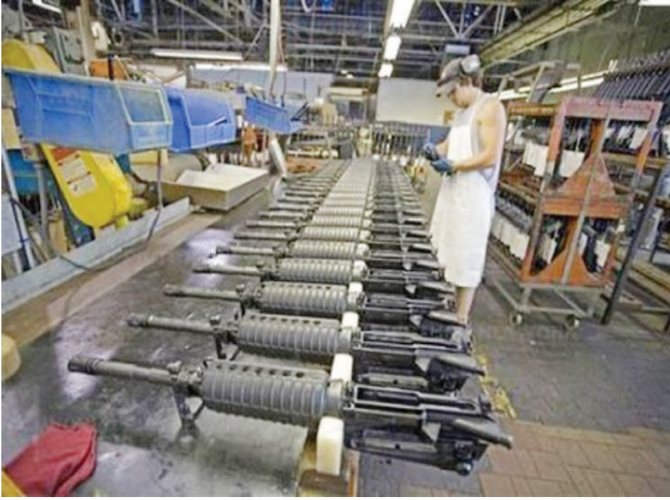
ਵਪਾਰ ਦਾ 28% ਹੈ। ਇਹ ਰੂਸੀ ਹਥਿਆਰ ਵਪਾਰ ਦੇ ਮੁਕਾਬਲੇ ਚਾਰ ਗੁਣਾਂ ਅਤੇ ਚੀਨੀ ਹਥਿਆਰ ਵਪਾਰ ਦੇ ਮੁਕਾਬਲੇ ਪੰਜ ਗੁਣਾਂ ਹੈ। ਯੂਰਪੀਨ ਦੇਸ਼ਾਂ ਦਾ ਆਪਸੀ ਜੰਗੀ ਹਥਿਆਰ ਵਪਾਰ ਸਿਰਫ਼ ਸੱਤ ਪ੍ਰਤੀਸ਼ਤ ਹੈ, ਬਾਕੀ ਹਥਿਆਰ ਦੂਸਰੇ ਮਹਾਂਦੀਪਾਂ ਦੇ ਦੇਸ਼ਾਂ ਨੂੰ ਵੇਚੇ ਜਾਂਦੇ ਹਨ। ਚਾਰ ਯੂਰਪੀਨ ਦੇਸ਼ ਫਰਾਂਸ, ਜਰਮਨੀ, ਇਟਲੀ ਅਤੇ ਸਪੇਨ ਹਥਿਆਰ ਵੇਚਣ ਵਾਲੇ ਦੇਸ਼ਾਂ ਵਿੱਚ ਕ੍ਰਮਵਾਰ ਦੂਜੇ, ਚੌਥੇ, ਛੇਵੇਂ ਅਤੇ ਦਸਵੇਂ ਨੰਬਰ ਤੇ ਆਉਂਦੇ ਹਨ।

ਇਸਦਾ ਸਵੀਡਨ ਸਥਿਤ ਸਟਾਕਹੋਮ ਇੰਟਰਨੈਸ਼ਨਲ ਪੀਸ ਰਿਸਰਚ ਇੰਸਟੀਚਿਊਟ (ਸਿਪਰੀ) ਦੀ ਇਸ ਸਾਲ ਦੀ ਰਿਪੋਰਟ ਵਿੱਚ ਖੁਲਾਸਾ ਹੋਇਆ ਹੈ। ਇੱਥੋਂ ਤੱਕ ਕਿ ਇਕੱਲੇ ਯੂਰਪ ਵਿੱਚ