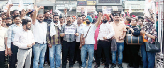
ਰੋਡ ਸ਼ੋਅ ਕੱਢਿਆ ਗਿਆ ਅਤੇ ਪੀ ਐੱਸ ਪੀ ਸੀ ਐੱਲ ਟੀ ਮੈਨੇਜਮੈਂਟ ਦੇ ਅਫ਼ੀਸਰ ਲਵਦੀਏ ਅਤੇ ਵਾਅਦਾ-ਖਿਲਾਫ਼ੀ ਵਿਰੁੱਧ ਮੁੱਖ ਦਫ਼ਤਰ (ਹੱਡ ਆਫਿਸ) ਪਟਿਆਲਾ ਵਿਖੇ ਲਗਾਇਆ ਗਿਆ