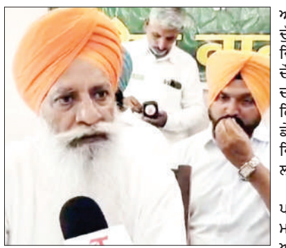
ਸਿੱਧਾ ਅਸਰ ਦੇਸ਼ ਦੇ ਕਰੋੜਾਂ ਕਿਸਾਨਾਂ ਦੀ ਰੋਜ਼ੀ-ਰੋਟੀ ‘ਤੇ ਪਵੇਗਾ। ਉਨ੍ਹਾਂ ਕਿਹਾ ਕਿ ਫਰਵਰੀ 2025 ਤੋਂ ਭਾਰਤ ਅਤੇ ਅਮਰੀਕਾ ਵਿਚਕਾਰ ਵਪਾਰਕ ਗੱਲਬਾਤ ਚੱਲ ਰਹੀ ਹੈ