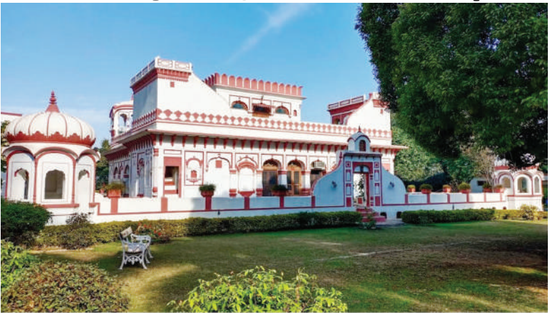
ਨਾਲਾਗੜ੍ਹ ਵਿੱਚ ਸਥਿਤ ਰਿਆਸਤੀ ਕਿਲ੍ਹਾ

ਗਏ। ਰਾਜਾ ਹਰੀ ਚੰਦ ਜਦੋਂ ਹੋਸ਼ ਵਿੱਚ ਆਇਆ ਤਾਂ ਉਸ ਨੇ ਪਹਾੜੀ ਫ਼ੌਜਾਂ ਦੀ ਅਗਵਾਈ ਕਰਦਿਆਂ ਗੁਰੂ ਜੀ ਵੱਲ ਤੀਰਾਂ ਦੀ ਬੁਝਾੜ ਕਰ ਦਿੱਤੀ। ਇਨ੍ਹਾਂ ਵਿੱਚੋਂ ਇੱਕ ਤੀਰ ਗੁਰੂ ਜੀ ਦੇ ਘੋੜੇ ਨੂੰ ਲੱਗਾ ਅਤੇ ਦੂਜਾ ਤੀਰ ਗੁਰੂ ਸਾਹਿਬ ਦੇ ਕੰਨ ਨੂੰ ਫੁੱਟਦਾ ਹੋਇਆ ਨਿਕਲ ਗਿਆ। ਤੀਸਰਾ ਤੀਰ ਗੁਰੂ ਸਾਹਿਬ ਦੇ ਕਮਰ ਬੰਦ ਵਿੱਚ ਆਣ ਖੁੰਭਿਆ, ਜਿਸ ਦੇ ਅਗਲੇ ਹਿੱਸੇ ਦੀ ਨੱਕ ਗੁਰੂ ਜੀ ਦੇ ਸਰੀਰ ਨੂੰ ਜਾ ਚੁੱਭੀ। ਇਸ ਤੋਂ ਬਾਅਦ